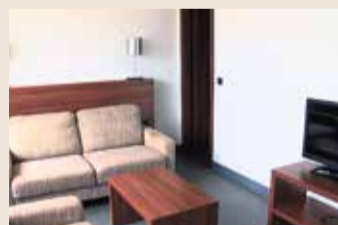
Wohnzimmer eines Apartments der neuen Übergangunterkunft in der Frankfurter Innenstadt.

Apartments für Alleinstehende als auch für Großfamilien. Jedes Zimmer ist mit Küche und Badezimmer ausgestattet. Außerdem gibt es in der Übergangunterkunft ein Front Office. Dort werden die Bewohner bei verschiedenen Anliegen von den Mitarbeitern des Arbeiter-Samariter-Bunds Deutschland e. V. beraten. Der Krieg in der Ukraine hat die Flüchtlingssituation in Frankfurt im letzten Jahr erheblich verändert. So wurden der Mainmetropole im letzten Jahr über 8.500 Geflüchtete zugewiesen. Für sie mussten, quasi über Nacht, Unterkünfte geschaffen werden. Eigentliches Ziel ist aber die Schaffung langfristiger Quartiere, nicht nur für Ukrainer.