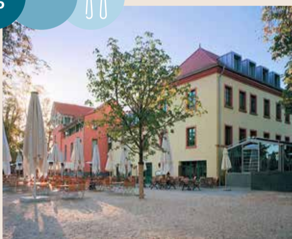
Die historische Gerbermühle – heute ein beliebtes Ziel für Touristen.