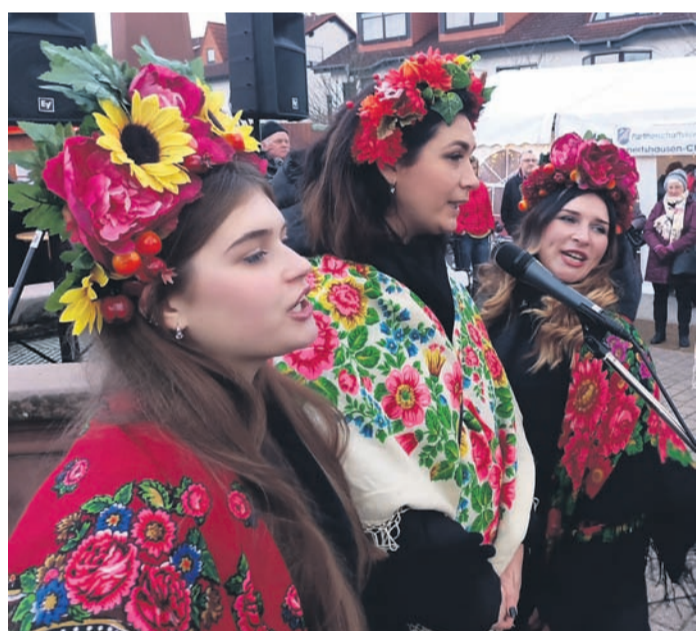
Die ukrainische Gesangsformation „Kalyna“ sang zur Eröffnung des Weihnachtsmarktes Lieder aus ihrer Heimat.