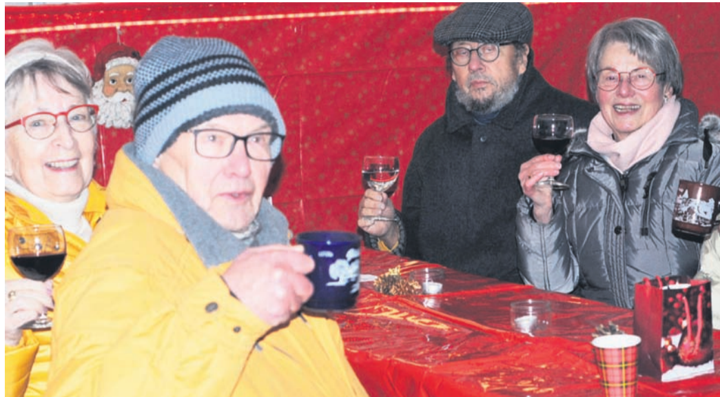
Das Zelt des Partnerschaftskomitee Chaource ist stets eine gute Mischung aus deutscher Weihnacht und französischen Lebensart.