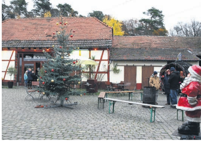
Ein Foto vom zweiten Advent 2022 auf der Thomashütte: Einen „richtigen“ Weihnachtsmarkt wie 2019 führt der Gutshof diesmal nicht durch, verkauft lediglich Glühwein und Plätzchen im Innenhof. Generell planen die Betreiber am beliebten Ausflugsziel zwischen Eppertshausen und Messel keine großen öffentlichen Veranstaltungen mehr.

Betreiber des Gutshofs bei Eppertshausen konzentrieren sich künftig auf Hochzeiten und Co. Nach Verlust 2019 aktuell kein „richtiger“ Weihnachtsmarkt