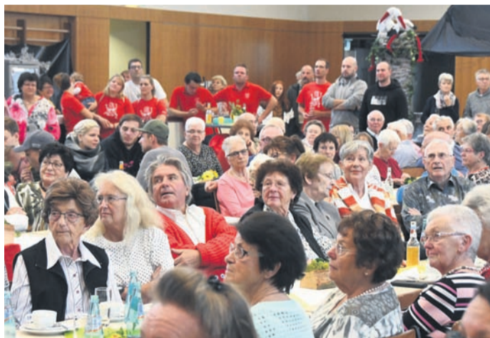
Derzeit braucht man sie nicht, der nächste Hitzesommer kommt aber sicher: Unter den Eppertshäuser Investitionen 2023 befinden sich auch 135.000 Euro für eine Klimaanlage in der Bürgerhalle, hier der große Saal bei einer Kerbveranstaltung.