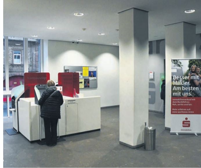
Schließungen von Filialen und SB-Standorten plant die Sparkasse Dieburg in diesem Jahr nicht.

ten. „Das war eine fulminante Rückkehr der Zinsen“, so Euler. Zuvor habe man ein Jahrzehnt lang Null- oder gar Minuszinsen verzeichnet. Die Strafzinsen für hohe Sichteinlagen - etwa auf dem Tagesgeldkonto - hat die Sparkasse Dieburg wieder abgeschafft, verzinst dortige Guthaben aber noch nicht wieder positiv. Zwar liegen die Zinsen auf Festgeld-Verträge nun wieder höher (zum Beispiel bei 1,5 Prozent für eine Anlage auf zwei Jahre), bei den Immobilienkrediten ist der Anstieg aber noch stärker. Deshalb wird der Wind auf dem Immobilienmarkt nach