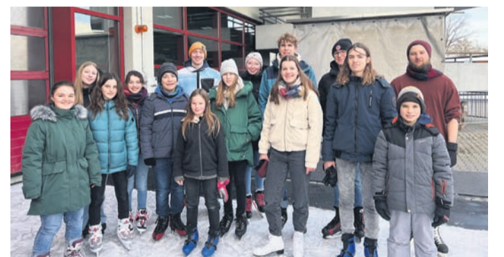
Kürzlich unternahm das Jugendorchester des Musikvereins Münster seinen ersten Ausflug in diesem Jahr in die Eissport-halle Frankfurt. Dort verbrachte das Jugendorchester ein paar schöne Stunden auf dem Eis. Zwischendrin konnte das Jugendorchester der U 17- Mannschaft der Löwen bei einem Eishockeyspiel gegen Kassel zuschauen und eine gemeinsame Mittagspause auf der Tribüne machen.

Dazu hält der Pfarrer eine Andacht und lädt ein von früher zu erzählen, zusammen zu lachen und zu klagen. Das Erzähl-Café ist aus der früheren Frauenhilfe und der Single-Gruppe hervorgegangen. Jeweils am 3. Donnerstag im Monat von 15 bis 16.30 Uhr sind Menschen ab 55 Jahren eingeladen, unabhängig von Konfession oder Geschlecht. Das nächste Mal findet das Erzählcafé mit Kreppl und Kaffee am 16. Februar um 15 Uhr im Gemeindehaus Altheim, Kirchstraße 18, statt.