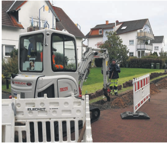
In die Beseitigung weißer Flecken im Glasfasernetz investiert Münster dieses Jahr 1,6 Millionen Euro. Das Foto entstand kürzlich in der Walterstraße.

seits tief in den roten Zahlen steckt und in Ermangelung anderer Einnahmequellen nur durch höhere Zahlungen seiner 23 Städte und Gemeinden einen genehmigungsfähigen Haushalt zustande bringen kann, sorgt der Anstieg bei den Umlagen in Münster zu