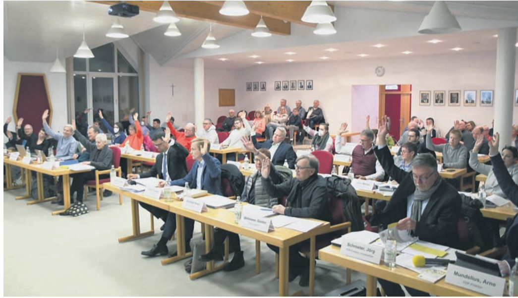
Zurück im engen Sitzungssaal des Rathauses waren nach drei Jahren in der Kulturhalle am Montagabend die Münsterer Gemeindevertreter.

Im November hatte Schledt seinen Entwurf zur weiteren Beratung ins gewählte Gremium eingebracht - und damals von einem „Doppel-Wumms“ gesprochen. Im Gegensatz zu Bundeskanzler Olaf Scholz verband Schledt die Münsterer Version allerdings mit Negativem: Mit der für seine Gemeinde um 1,4 Millionen Euro (ziemlich genau 100 Euro pro Einwohner von Münster, Altheim und Breitefeld) gestiegene Kreis- und Schulumlage sowie der Rückzahlung von einer Million Euro eigentlich schon eingeplanter Gewerbesteuer ans Finanzamt (das das Geld einem örtlichen Unternehmen unrechtmäßig abgenommen hatte), hatte Schledt zwei zentrale - nicht vom Rathaus verursachte - Faktoren fürs aktuelle Missverhältnis