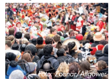
Karneval muss kein Fest für Viren sein.

wirkt ursächlich gegen Erkältungsviren, indem er sie umhüllt und daran hindert, in die Zellen der Nasenschleimhaut einzudringen. So steht einer unbeschwerteren jecken Zick nichts mehr im Wege. Und: Selbst bei einer bestehenden Erkältung kann das Erkältungsspray die Symptome lindern und die Erkrankungsdauer verkürzen. 1 Weitere Informationen gibt es auf www.algovir.de .