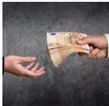
Es geht um viel Geld.

Bei einem Widerruf erhalten Sie – anders als bei der Kündigung – alle eingezahlten Beiträge ohne Abzug von Maklerprovisionen und Verwaltungskosten zurück. Und nicht nur das: Die Versicherung muss Sie auch an dem mit Ihrem Geld erzielten Anlagegewinn beteiligen. So können Sie bis zu 150 % der eingezahlten Beiträge zurückholen. Ein sattes Plus auf Ihrem Konto winkt!