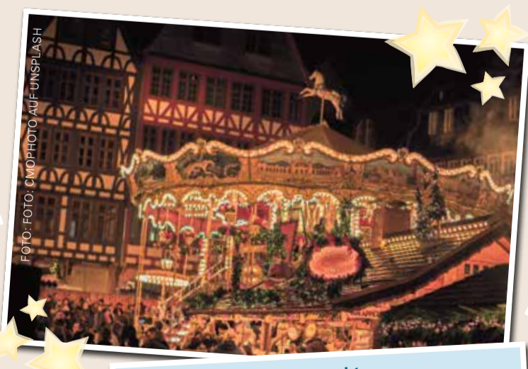
Frankfurter Weihnachtsmarkt 27. November bis 21. Dezember 2023 (Liebfrauenberg und Str., Paulsplatz, Römerberg, Fahrtor, Mainkai)