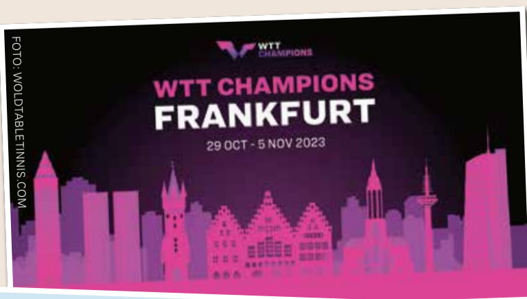
WTT-Turnier (Wold Table Tennis) 29. Oktober bis 5. November 2023 (Fraport Arena)