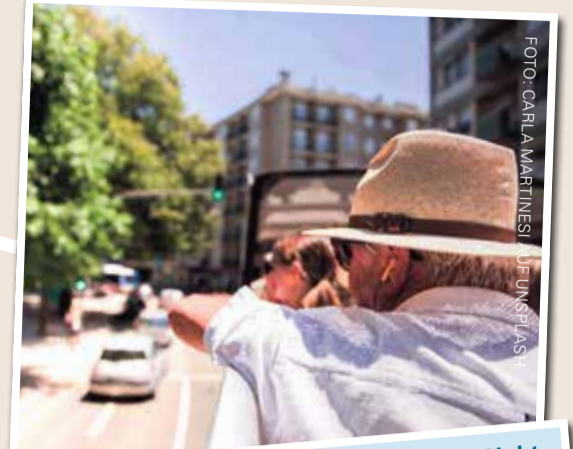
Express Tour Hop-On-Hop-Off (Frankfurt Sightseeing GmbH) - Gesamtdauer: ca. 1 Stunde (ohne Stops) 1. Februar 2023 - Innenstadt