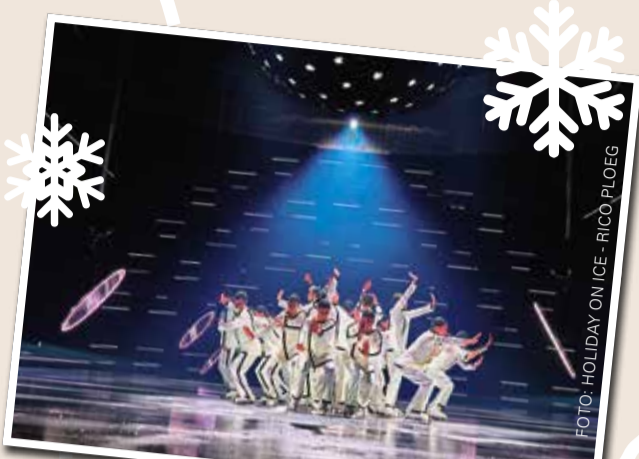
HOLIDAY ON ICE - (Show & Varieté) Festhalle Frankfurt - 03.01. - 08.01.2023