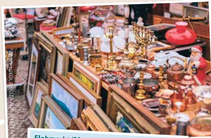
Flohmarkt (Museumsufer) Am Schaumainkai - Ab dem 7. Januar 2023 jeden 2. Samstag zwischen 9 und 14 Uhr