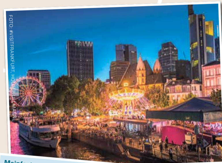
Mainfest 4. - 7. August 2023 (Römerberg, Fahrtor, Mainkai)