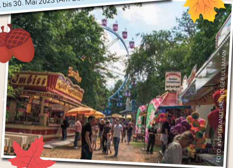
Wäldchestag (Sommergärten und Volksfest) 27. bis 30. Mai 2023 (Am Oberforsthaus im Stadtwald)