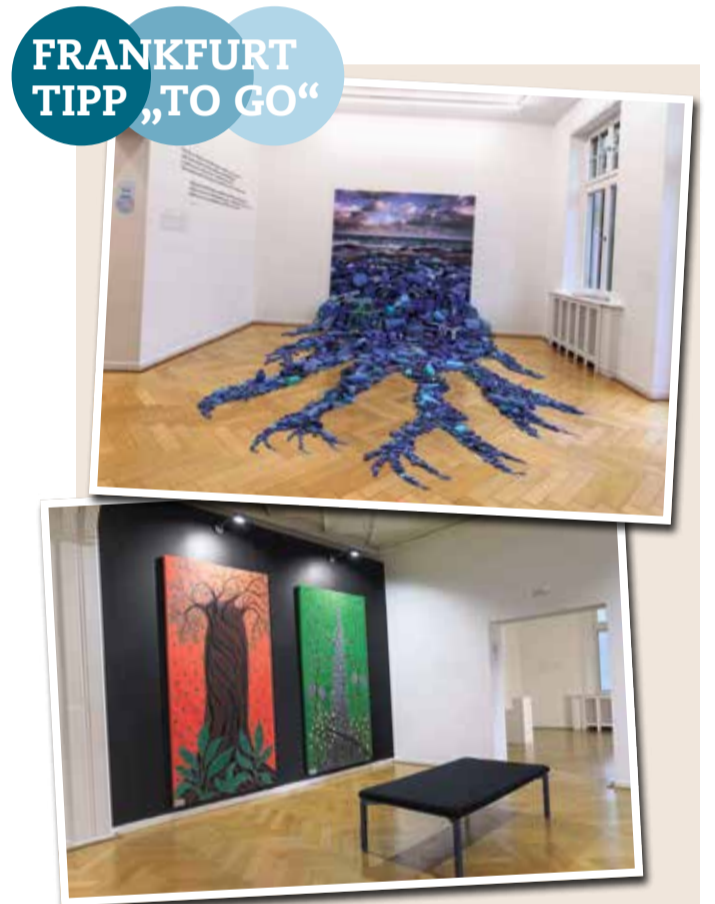
Alejandro Duran, Washed Up. Transforming a Trashed Landscape. Ausstellungsansicht „healing. Leben im Gleichgewicht“. Weltkulturen Museum.