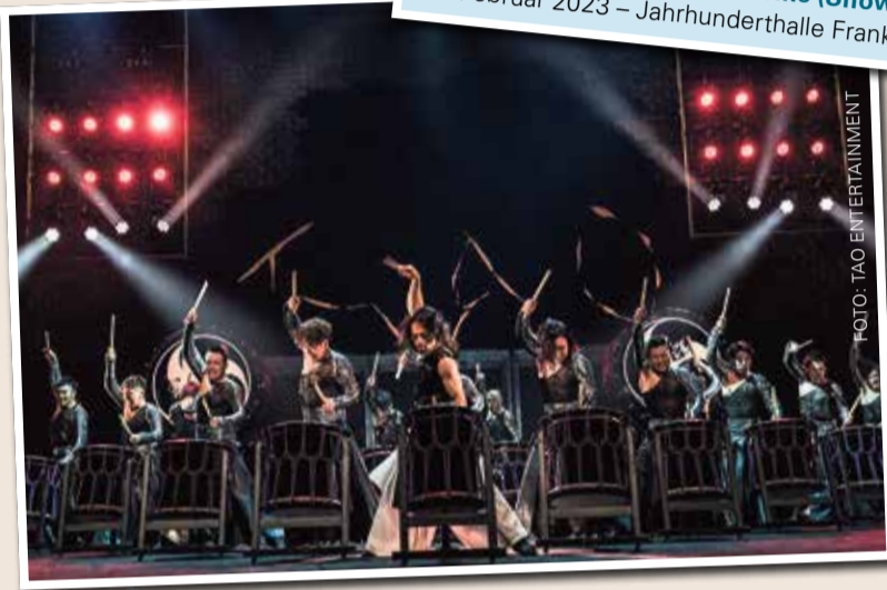
TAO - Die Kunst des Trommelns (Show & Varieté) 11. Februar 2023 - Jahrhunderthalle Frankfurt