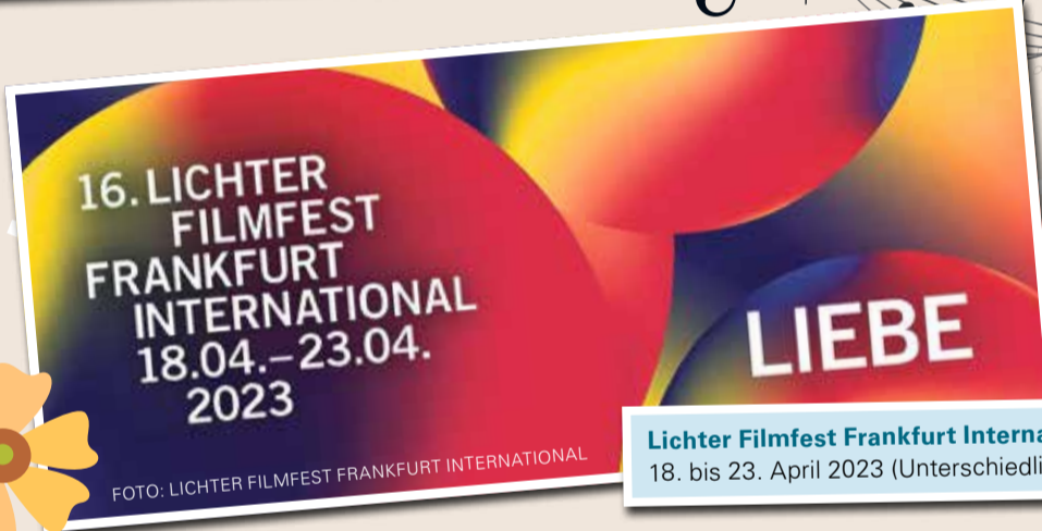
Lichter Filmfest Frankfurt International 18. bis 23. April 2023 (Unterschiedliche Spielorte)