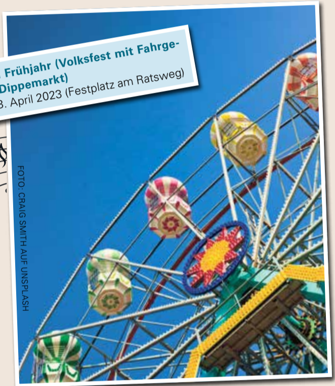
Dippemess im Frühjahr (Volksfest mit Fahrgeschäften und Dippemarkt) 31. März bis 23. April 2023 (Festplatz am Ratsweg)