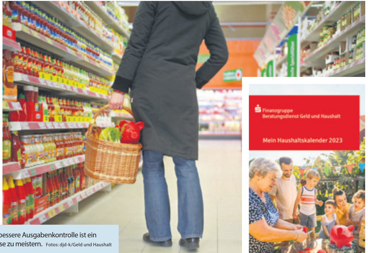
Bewusster einkaufen und sparen. Eine bessere Ausgabenkontrolle ist ein wichtiger Schritt, um finanzielle Engpässe zu meistern.

(DJD-K). Die stark steigenden Preise für Energie und Lebensmittel schaffen Unsicherheit bei vielen Menschen – bis hin zur Sorge, manche Rechnungen vielleicht gar nicht mehr bezahlen zu können. Was lässt sich tun, um tägliche Ausgaben zu reduzieren und sich mehr finanziellen Spielraum zu verschaffen? Hilfreich ist es zunächst, einen besseren Überblick über alle festen Ausgaben wie Miete, Handy oder Strom und die veränderlichen Positionen zu erhalten. Wer anfängt, konsequent Buch zu führen über alle Kosten, findet meist überflüssige oder verzichtbare Ausgaben. Ein Haushaltsbuch oder beispielsweise der neue Haushaltskalender 2023 helfen dabei. Beide Broschüren sind kostenfrei unter www.geld-und-haushalt.de oder telefonisch unter 030/20455818 erhältlich.