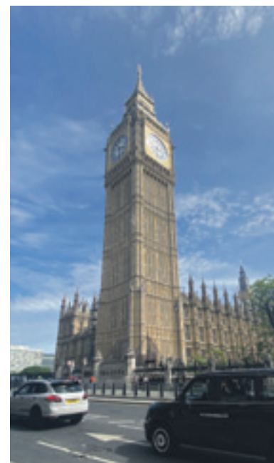
Der Big Ben.

weiteren Fahrten nichts mehr abgebucht. Aufladen lässt sich die Karte an fast jedem Fahrkartenautomaten. Wer keine zusätzliche Karte dabei haben möchte, kann aber auch einfach seine Kreditkarte nutzen.