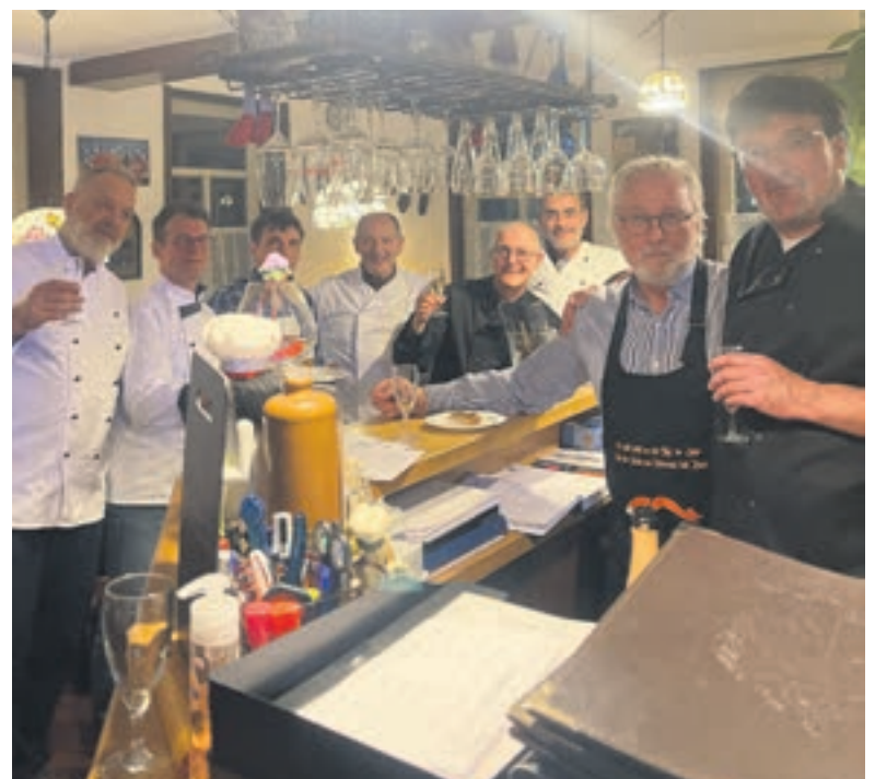
Ein Teil der Gründungsmitglieder erfreuen sich eines gelungenen Club-Starts.

erfahren möchte, der findet umfassende Informationen unter: „ www.cc-club-kochender-maenner.de “.