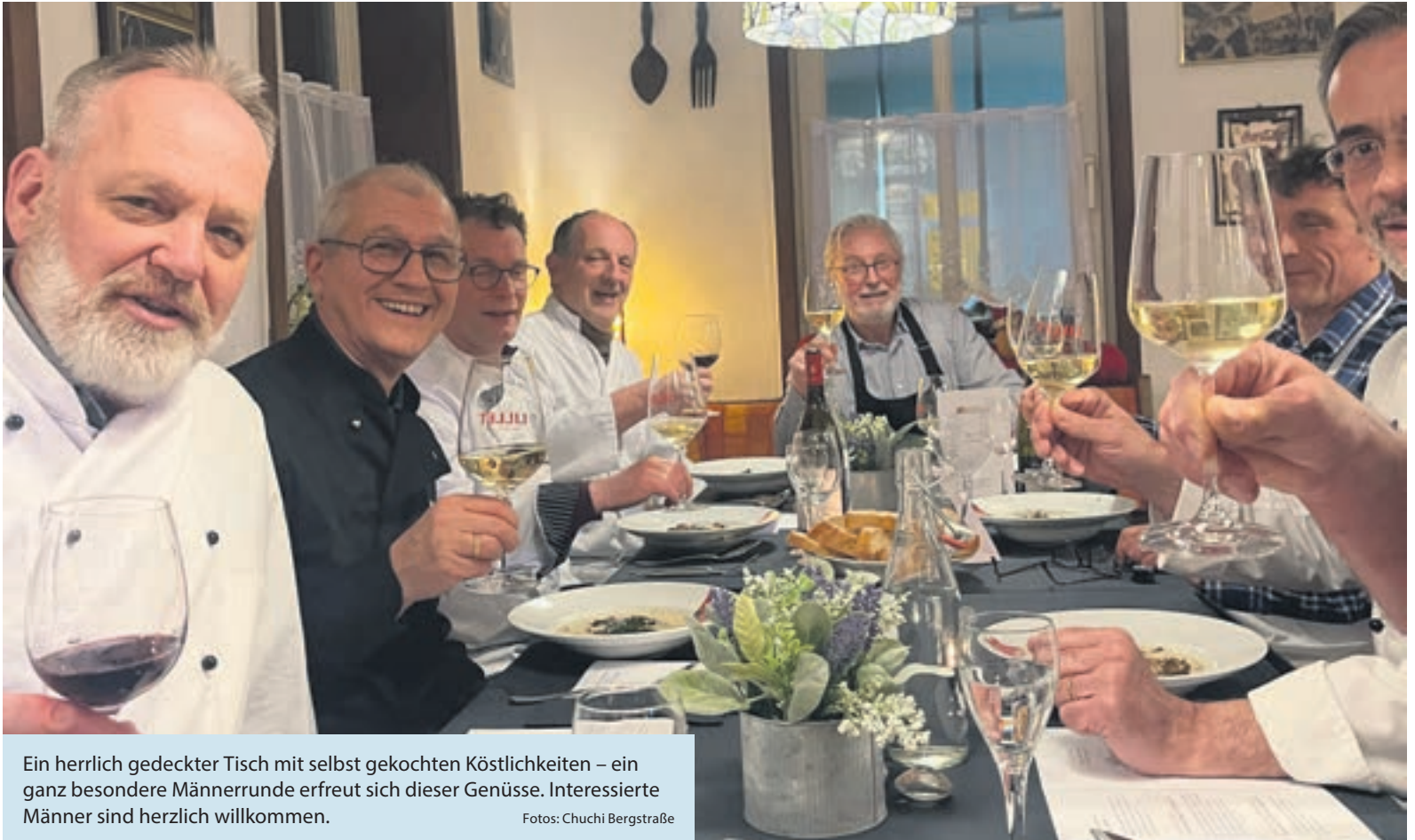
Ein herrlich gedeckter Tisch mit selbst gekochten Köstlichkeiten – ein ganz besondere Männerrunde erfreut sich dieser Genüsse. Interessierte Männer sind herzlich willkommen.