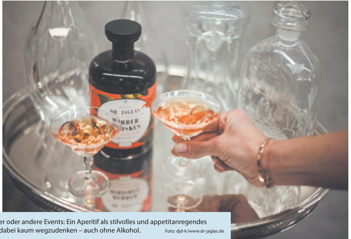
Ob Geburtstagsparty, Weihnachtsfeier oder andere Events: Ein Aperitif als stilvolles und appetitanregendes Begrüßungsgetränk für die Gäste ist dabei kaum wegzudenken – auch ohne Alkohol.

(DJD-K). Ob zum Geburtstag, der Weihnachtsparty oder anderen Events: Ein Aperitif als Begrüßungsgetränk ist kaum wegzudenken. Zu den klassischen Aperitifs gehören etwa Sekt und Portwein oder Longdrinks wie Gin Tonic und Hugo. Ein köstlicher alkoholfreier Aperitif ist beispielsweise der „Herbe Hibiskus – San Aperitivo“ vom Berliner Apotheken-Label „Dr. Jaglas“. Hibiskusblüten und Kräuter wie Enzian und Chirettakraut sorgen für einen erfrischend-herben Geschmack, die rötliche Farbe erinnert an den beliebten Aperol Spritz. Der Drink passt zu vielen Anlässen und kann mit alkoholfreiem Sekt, Tonic oder Mineralwasser sowie ein paar Spritzern Limettensaft serviert werden. Unter www.dr-jaglas.de kann der Aperitivo direkt bestellt werden – auf Wunsch in einem schönen Geschenkkarton.