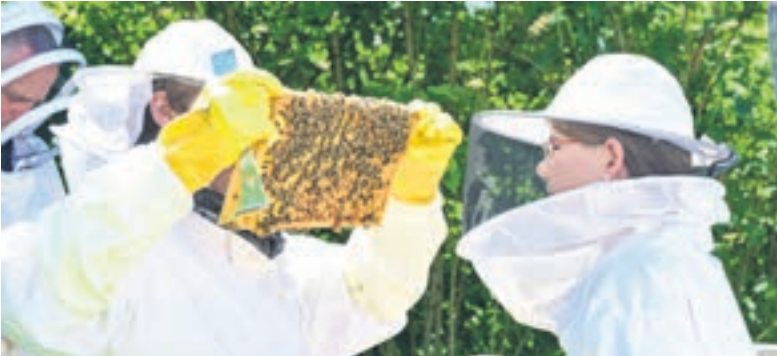
Die Imkerei erfreut sich zunehmender Beliebtheit. Sie verbindet Naturschutz, ein spannendes Hobby und eine köstliche Ernte.

Auf Imker-Neulinge warten spannende und zeitgemäße Aufgaben