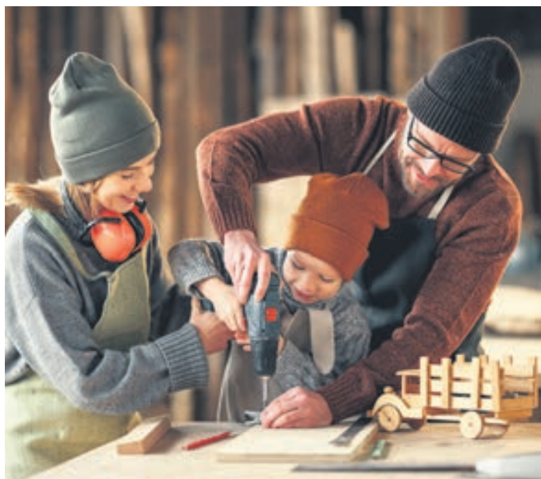
Eigenleistung senkt die Baukosten und den Kreditbedarf bei der Bank.

Wer mangels Eigenkapital das Kreditvolumen bei der Bank senken möchte, kann den Kapitalmangel teilweise durch Eigenleistungen ausgleichen. Bis zu 15 Prozent der Darlehenssumme akzeptieren Banken als „Muskelhypothek“. „Eigenkapital anzusparen ist so wichtig wie nie“, betont der BHW-Experte. „Dafür und auch zur Zinssicherung ist der Bausparvertrag ein ideales Instrument.“ Er wird von der Bank wie Eigenkapital bewertet und sichert für das zukünftige Darlehen die im langjährigen Mittel immer noch günstigen Zinsen. Wer schließlich das neue Eigenheim bezieht, kann zudem sicher sein: Die Inflation hilft beim Abtrag.