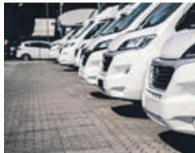
Wohnwagen sind aktuell sehr beliebt.

Unabhängig vom Fahrzeugtyp sollten Mietinteressenten genug Zeit für ihren Urlaub einplanen. Denn unter einer Woche vermieten die wenigsten Händler ihre Fahrzeuge. Das hat aber einen guten Grund, über den sich Kunden freuen können: In den vergangenen zwei Jahren sind die Hygienestandards nochmal gestiegen.