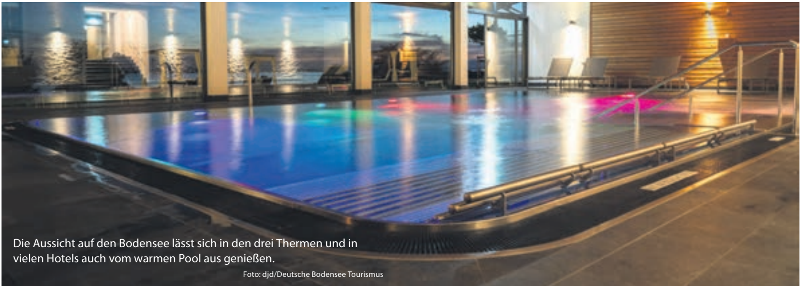
Die Aussicht auf den Bodensee lässt sich in den drei Thermen und in vielen Hotels auch vom warmen Pool aus genießen.