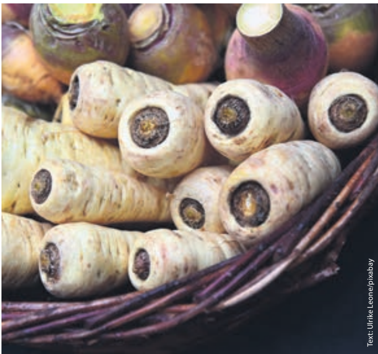
Text: Ulrike Leone/pixabay