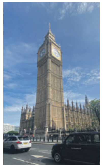
Der Big Ben.

weiteren Fahrten nichts mehr abgebucht. Aufladen lässt sich die Karte an fast jedem Fahrkartenautomaten. Wer keine zusätzliche Karte dabei haben möchte, kann aber auch einfach seine Kreditkarte nutzen.