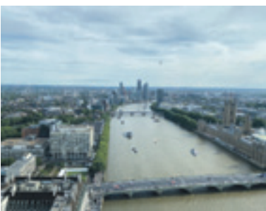
Blick aus dem London Eye auf die Themse.

Eindrucksvolle Sehenswürdigkeiten, hippe Ausgehviertel, tolle Street-Art, angesagte Märkte, Kunst und Kultur, wohin das Auge blickt – London ist so unglaublich vielfältig und deshalb mehr als eine Reise wert. Wer London einmal lieben gelernt hat, wird immer wiederkehren.