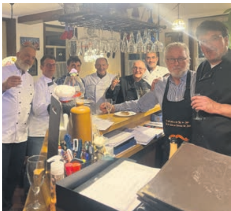
Ein Teil der Gründungsmitglieder erfreuen sich eines gelungenen Club-Starts.

erfahren möchte, der findet umfassende Informationen unter: „ www.cc-club-kochender-maenner.de “.