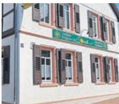
Das Gasthaus „Zur Sonne“ in Alsbach-Hähnlein.

Im „Gasthaus Zur Sonne“ in Alsbach köchelt die „Chuchi Bergstraße“ Club kochender Männer Deutschland e.V.