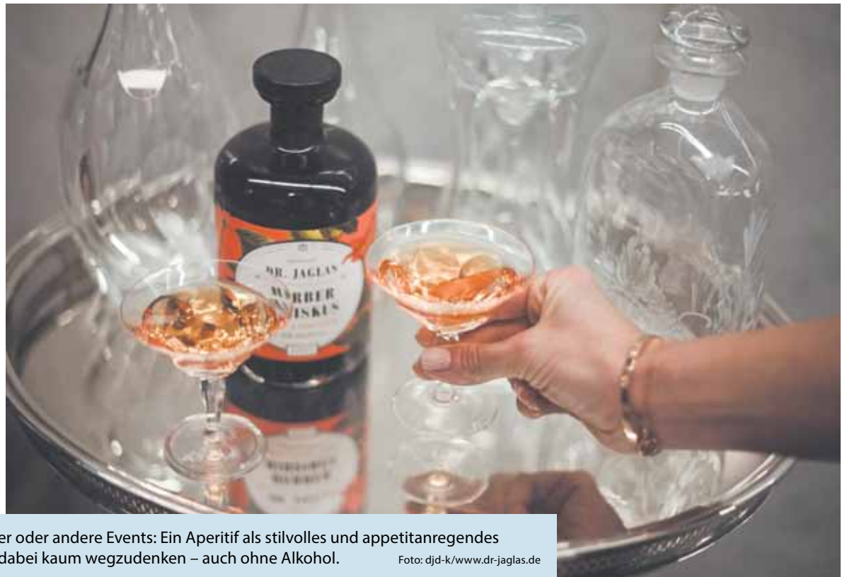
Ob Geburtstagsparty, Weihnachtsfeier oder andere Events: Ein Aperitif als stilvolles und appetitanregendes Begrüßungsgetränk für die Gäste ist dabei kaum wegzudenken – auch ohne Alkohol.

(DJD-K). Ob zum Geburtstag, der Weihnachtsparty oder anderen Events: Ein Aperitif als Begrüßungsgetränk ist kaum wegzudenken. Zu den klassischen Aperitifs gehören etwa Sekt und Portwein oder Longdrinks wie Gin Tonic und Hugo. Ein köstlicher alkoholfreier Aperitif ist beispielsweise der „Herbe Hibiskus – San Aperitivo“ vom Berliner Apotheken-Label „Dr. Jaglas“. Hibiskusblüten und Kräuter wie Enzian und Chirettakraut sorgen für einen erfrischend-herben Geschmack, die rötliche Farbe erinnert an den beliebten Aperol Spritz. Der Drink passt zu vielen Anlässen und kann mit alkoholfreiem Sekt, Tonic oder Mineralwasser sowie ein paar Spritzern Limettensaft serviert werden. Unter www.dr-jaglas.de kann der Aperitivo direkt bestellt werden – auf Wunsch in einem schönen Geschenkkarton.