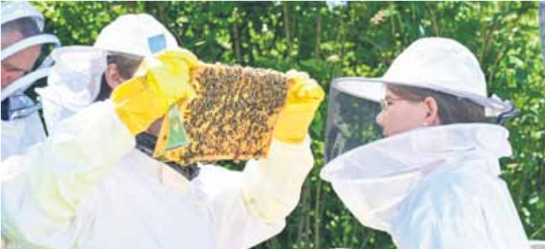
Die Imkerei erfreut sich zunehmender Beliebtheit. Sie verbindet Naturschutz, ein spannendes Hobby und eine köstliche Ernte.

Auf Imker-Neulinge warten spannende und zeitgemäße Aufgaben