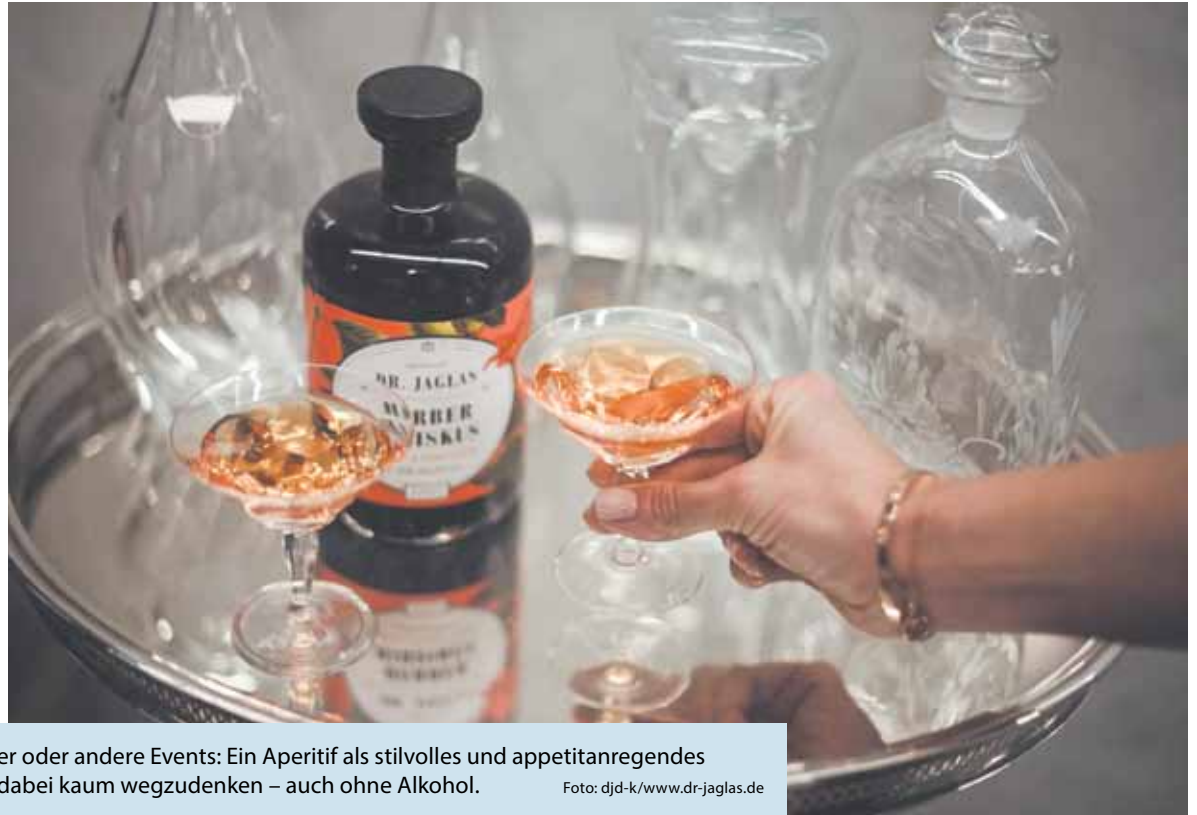
Ob Geburtstagsparty, Weihnachtsfeier oder andere Events: Ein Aperitif als stilvolles und appetitanregendes Begrüßungsgetränk für die Gäste ist dabei kaum wegzudenken – auch ohne Alkohol.

(DJD-K). Ob zum Geburtstag, der Weihnachtsparty oder anderen Events: Ein Aperitif als Begrüßungsgetränk ist kaum wegzudenken. Zu den klassischen Aperitifs gehören etwa Sekt und Portwein oder Longdrinks wie Gin Tonic und Hugo. Ein köstlicher alkoholfreier Aperitif ist beispielsweise der „Herbe Hibiskus – San Aperitivo“ vom Berliner Apotheken-Label „Dr. Jaglas“. Hibiskusblüten und Kräuter wie Enzian und Chirettakraut sorgen für einen erfrischend-herben Geschmack, die rötliche Farbe erinnert an den beliebten Aperol Spritz. Der Drink passt zu vielen Anlässen und kann mit alkoholfreiem Sekt, Tonic oder Mineralwasser sowie ein paar Spritzern Limettensaft serviert werden. Unter www.dr-jaglas.de kann der Aperitivo direkt bestellt werden – auf Wunsch in einem schönen Geschenkkarton.