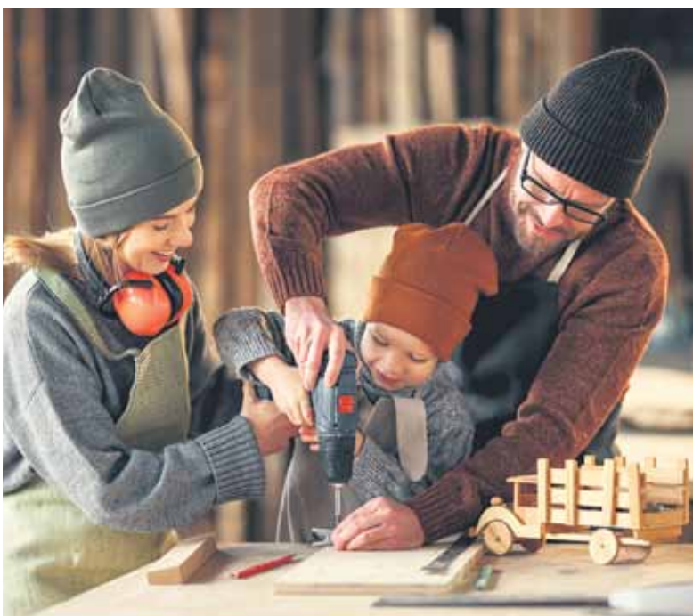
Eigenleistung senkt die Baukosten und den Kreditbedarf bei der Bank.