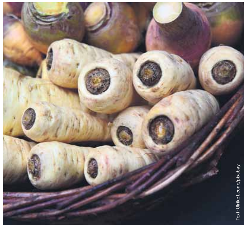
Text: Ulrike Leone/pixabay