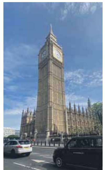
Der Big Ben.

weiteren Fahrten nichts mehr abgebucht. Aufladen lässt sich die Karte an fast jedem Fahrkartenautomaten. Wer keine zusätzliche Karte dabei haben möchte, kann aber auch einfach seine Kreditkarte nutzen.