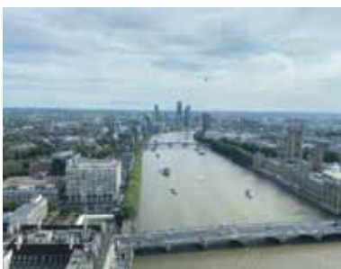
Blick aus dem London Eye auf die Themse.

Eindrucksvolle Sehenswürdigkeiten, hippe Ausgehviertel, tolle Street-Art, angesagte Märkte, Kunst und Kultur, wohin das Auge blickt – London ist so unglaublich vielfältig und deshalb mehr als eine Reise wert. Wer London einmal lieben gelernt hat, wird immer wiederkehren.