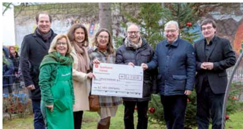
Die Neu-Isenburger Speisekammer freute sich sehr über die persönliche Wertschätzung ihres Einsatzes und der großzügigen Spendenübergabe.