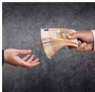
Es geht um viel Geld.

Bei einem Widerruf erhalten Sie – anders als bei der Kündigung – alle eingezahlten Beiträge ohne Abzug von Maklerprovisionen und Verwaltungskosten zurück. Und nicht nur das: Die Versicherung muss Sie auch an dem mit Ihrem Geld erzielten Anlagegewinn beteiligen. So können Sie bis zu 150 % der eingezahlten Beiträge zurückholen. Ein sattes Plus auf Ihrem Konto winkt!