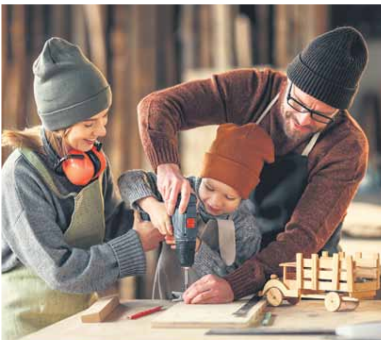
Eigenleistung senkt die Baukosten und den Kreditbedarf bei der Bank.