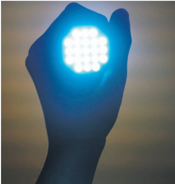
Eine Taschenlampe sollte immer bereit liegen.

Alle Kommunen, auch wir, hatten bereits Ablaufpläne für Stromausfälle. Die kamen und kommen immer mal wieder vor, das haben wir alle schon erlebt. Allerdings galten diese Pläne eher für lokal sehr begrenzte Ausfälle. Durch den Krieg in der Ukraine und die Energiekrise sind wir in eine andere Situation gekommen. Aktuell sind die Gasspeicher in Deutschland voll, das ist gut. Es ist allerdings nicht auszuschließen, dass sich dies im Laufe des Winters ändern könnte. Ein Großteil des in Deutschland verbrauchten Stroms wird über den Einsatz von Gas erzeugt. Auch könnte es sein, dass Menschen angesichts hoher Gaspreise mehr Strom verbrauchen, etwa durch elektrische Heizlüfter. Dies könnte das Stromnetz sehr strapazieren. Und natürlich besteht auch die Möglichkeit, dass durch Angriffe auf die kritische Infrastruktur oder Cyberangriffe die Stromversorgung unterbrochen wird. Auf all diese Szenarien wollen wir vorbereitet