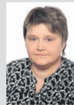
Gepr. Bestattungsfachkraft Trauerbegleiterin