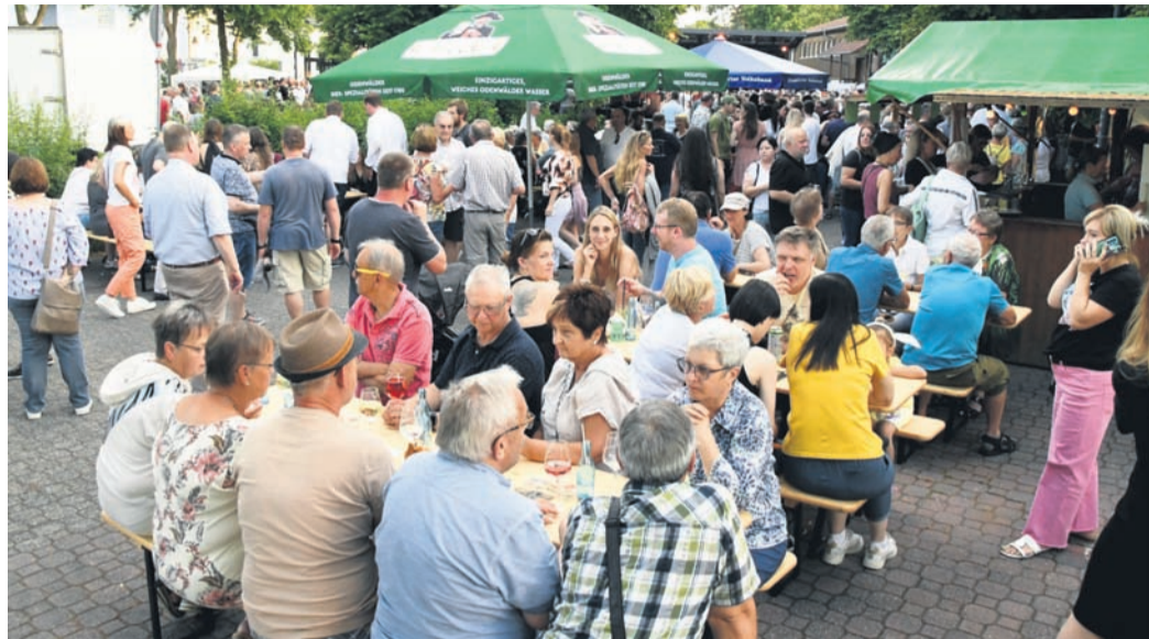
Wie beim „River Night Summer Special“ im Juni 2022 könnte der Münsterer Bahnhofsvorplatz auch im Frühjahr 2023 Treffpunkt werden, wenn dort der erste „Feierabend-Markt“ der Gemeinde stattfinden soll.

FDP-Antrag in der Gemeindevertretung erfolgreich / Warum die CDU dagegen war