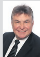
Geprüfter Bestatter Schreinermeister

Der verehrten Kundschaft und allen Einwohnern wünschen wir * * frohe Weihnachten und ein * * glückliches und erfolgreiches neues Jahr