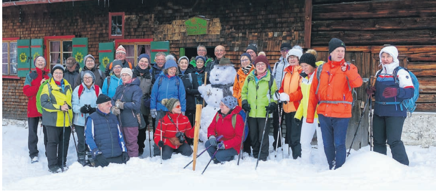
Reichlich Schnee gab es für die Wanderer des Odenwaldklubs im Kleinwalsertal.

Viele rieben sich am Morgen verwundert die Augen. Fast 15 Zentimeter Neuschnee verwandelte alles in eine prächtige Winterlandschaft. Nach dem Frühstück stand dann die erste Wanderung an. Die über Baad zur Bärghütte, mit einer ausgedehnten Mittagsrast, führte. Im Hotel angekommen freuten sich die meisten auf einen entspannten Ausklang in der Wellness-Oase, den verschiedenen Saunamöglichkeiten und dem Schwimmbad. Dem „Bierlax“ - die eher lustige Form des Skats -