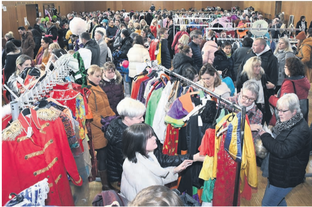
Menschen und Kostüme, wohin man sah: Die 22. Faschingsbörse der Kita St. Sebastian brach am Sonntag in der Bürgerhalle alle Rekorde.

Die Rekorde, die sie ansprach, waren eindrucksvoll: Mit 1 638 Kostümen, Einzelteilen oder Accessoires brachten 66 verschiedene Verkäufer aus Eppertshausen und Umgebung mehr Artikel denn je in die Halle. Das Team - neben der Handvoll Organisatoren rund 90 weitere Helfer - sortierte Kleidung und Co. vor, etwa nach Geschlechtern getrennt. „80 Prozent der angebotenen