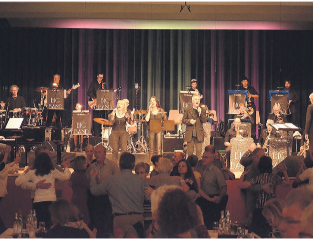
Endlich wieder zu beschwingten Klängen über das Parkett wirbeln – das ist am 5. März beim Tanztee in der Kulturhalle möglich.

Amtsverkündigungsorgan der Gemeinde Münster mit Ortsteil Altheim