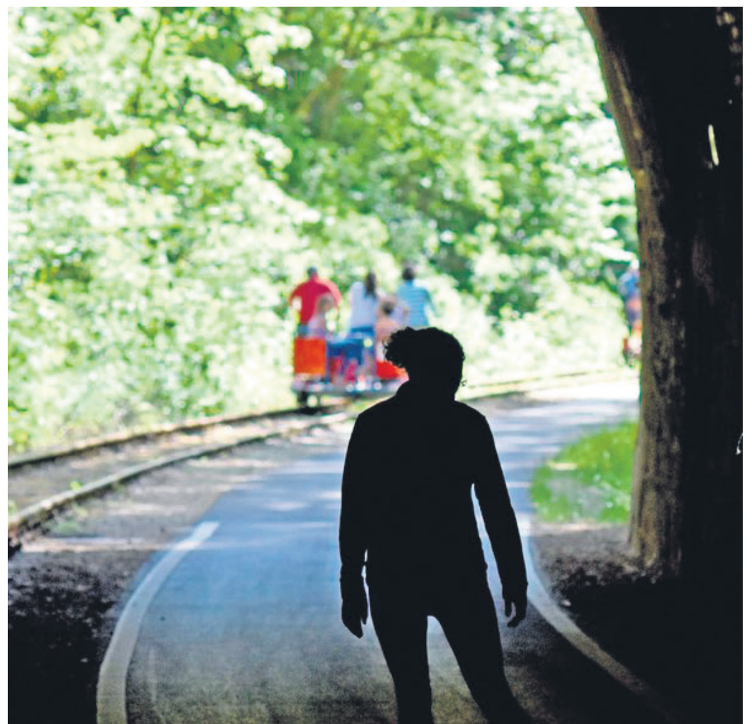
Fahrt mit der Draisine entlang des Kanonenbahn-Radwegs. Der 31 Kilometer lange Radwanderweg entlang einer stillgelegten Bahnstrecke passiert fünf Tunnel und zwei Viadukte.