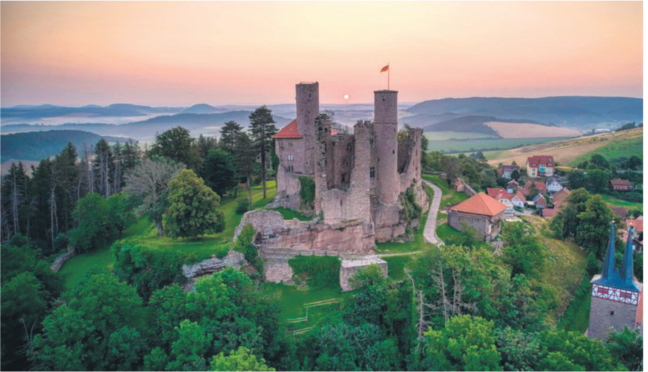
Blick auf Burg Hanstein bei Sonnenaufgang: Sie gilt als eine der größten Burgruinen Mitteldeutschlands.