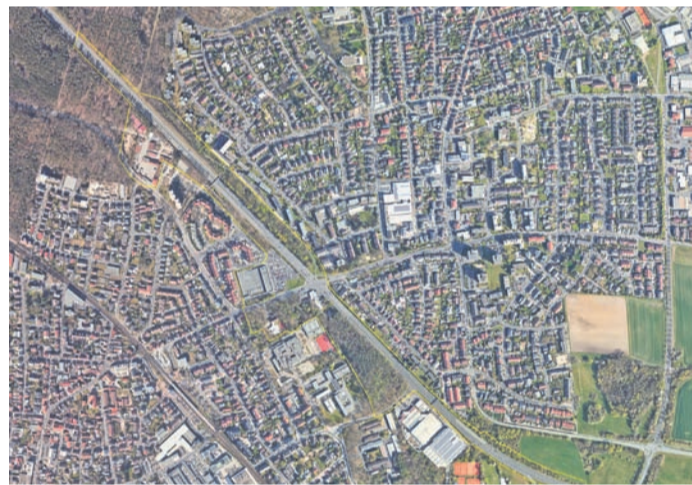
Dieser Auszug aus dem geographischen Informationssystem zeigt gelb umrandet das Wettbewerbsareal.

Obertshausen (NZO) Die Stadt Obertshausen hat sich auf den Weg gemacht, über die Zukunft der Bundesstraße 448 (B448) nachzudenken. Die vierspurige autobahnähnliche Bundesstraße könnte zu einer Stadtstraße zurückgebaut und die anliegenden Flächen entwickelt werden. Damit würde eine städtebauliche Chance für Obertshausen entstehen. Am 16. Oktober gab es bereits bei einem großen Beteiligungstag auf dem HIT-Parkplatz die Gelegenheit für alle Obertshausenerinnen und Obertshausener, Ideen und Meinungen der Stadt mit auf den Weg zu geben. Mit dem Ziel: Unter dem Motto „Es wird einmal...“ gemeinsam eine mögliche Zu-