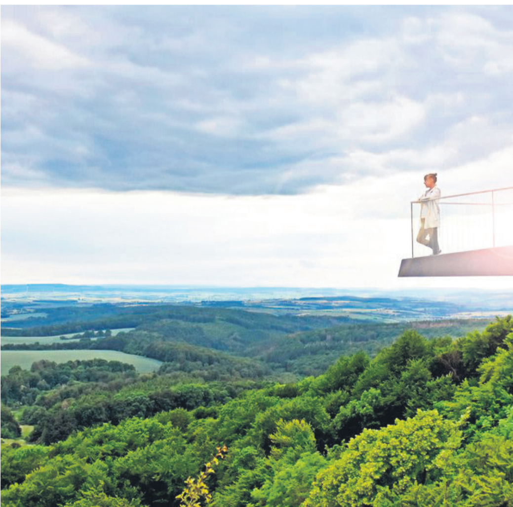
Der Skywalk Sonnenstein bietet einzigartige Ausblicke über die Landschaft im Eichsfeld bis hin zum südlichen Harz, zum Kyffhäuser, zum Ohmgebirge und zur Goldenen Mark Duderstadt.

Nicht versäumen sollte man zudem die beiden thüringischen Städte Leinefelde-Worbis und Dingelstädt, die „Stadt des Handwerks“.