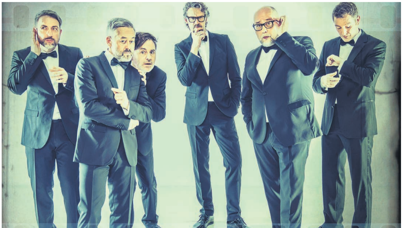
Six Pack beendet mit „Goldsinger“ am 28. April 2023 die Kleinkunstreihe 2022/23 im Hausener Bürgerhaus.