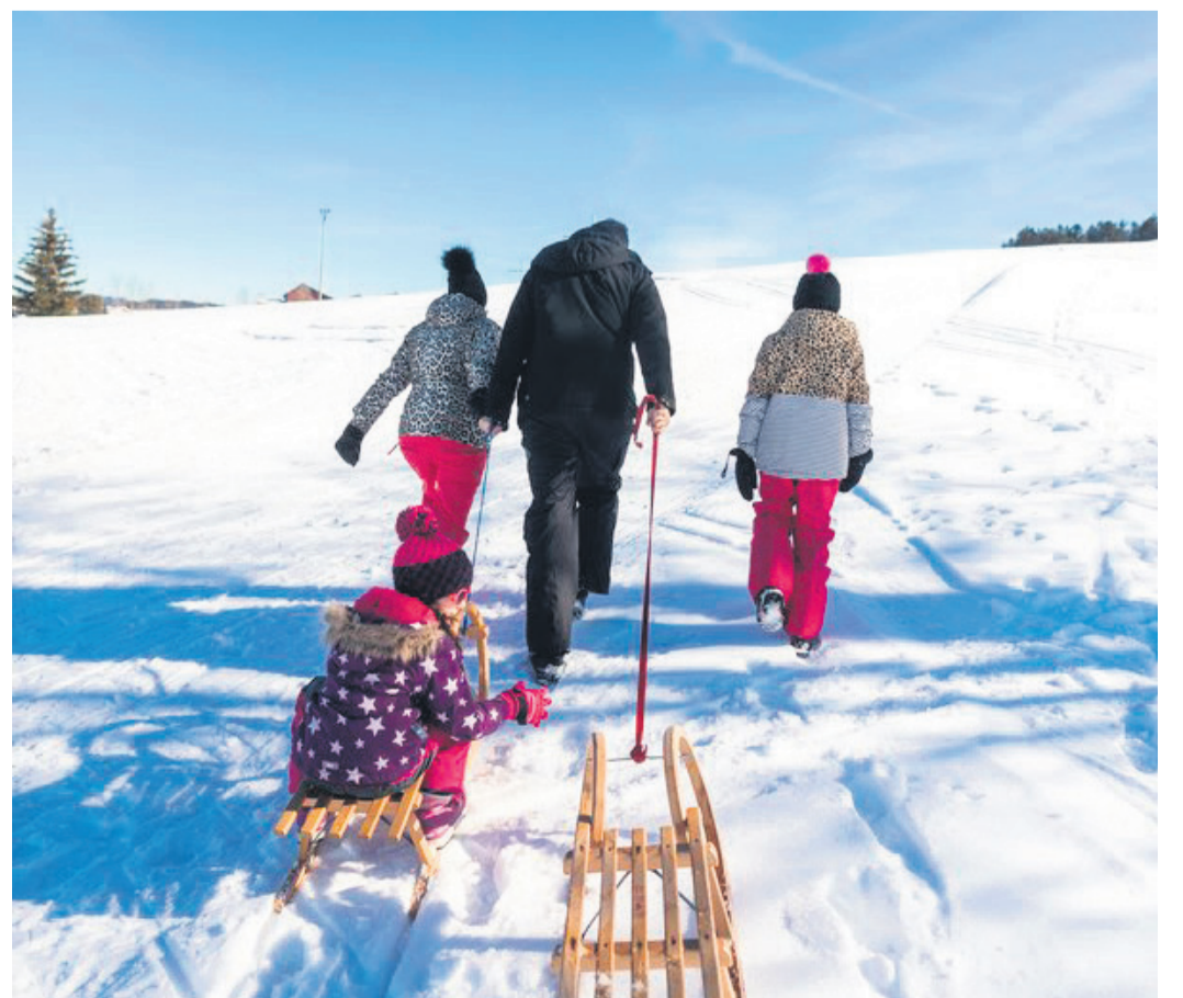
Die sanft-hügelige Landschaft lädt zum Rodeln, Winterwandern und Langlaufen ein.