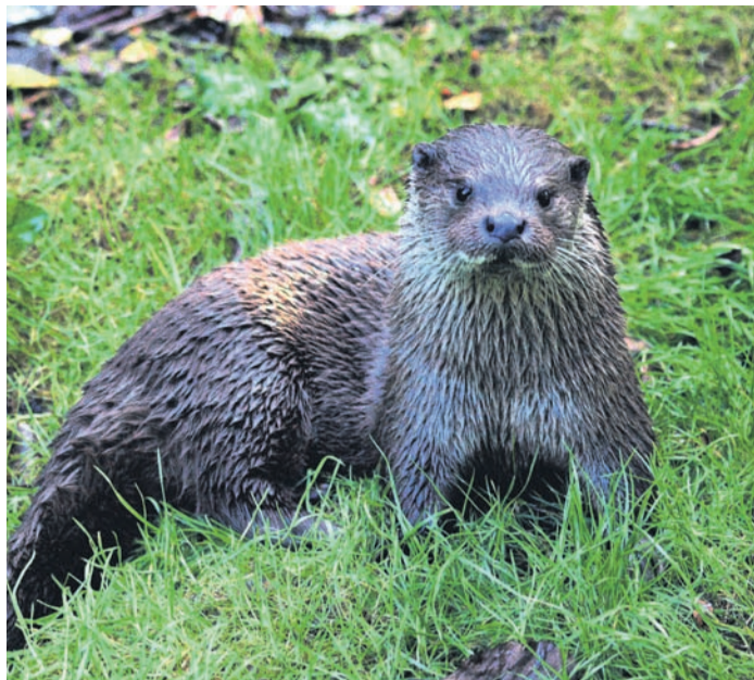
Fischotter in der „Alten Fasanerie“.