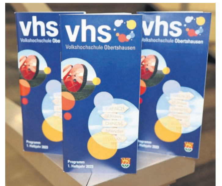
Viel zu bieten hat wieder das Programm der Volkshochschule. Derzeit wird das Heft mit den Angeboten fürs erste Halbjahr 2023 in den Briefkästen in Obertshausen verteilt.

Die Kurse können ab sofort online auf www.vhs-obertshausen.de , per E-Mail oder telefonisch gebucht werden. Bei Fragen zum Angebot erreichen Interessierte das Team der vhs unter Telefon: 06104 7034114 oder per E-Mail: vhs@obertshausen.de .