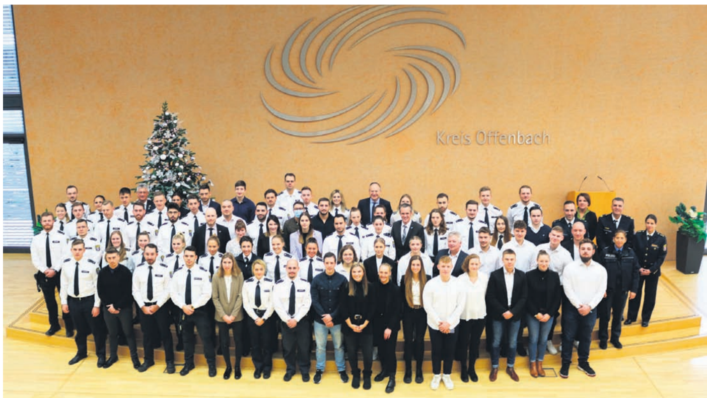
Neue Polizeibeamtinnen und Polizeibeamte 2022 begrüßt.