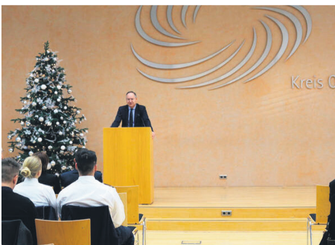
Landrat Oliver Quilling spricht bei der Begrüßung der neuen Polizeibeamtinnen und Polizeibeamten 2022.

Kreis Offenbach (NZO) Im Laufe des Jahres 2022 haben 100 Polizeibeamtinnen und -beamte ihren Dienst bei den Polizeidienststellen in Stadt und Kreis Offenbach beziehungsweise in der Kriminaldirektion des Polizeipräsidiums Südhessen angetreten, 35 davon in den verschiedenen Polizeidienststellen im Kreisgebiet. 65 Beamte und Beamtinnen kamen neu in Reviere der Stadt Offenbach oder in die Kriminaldirektion.