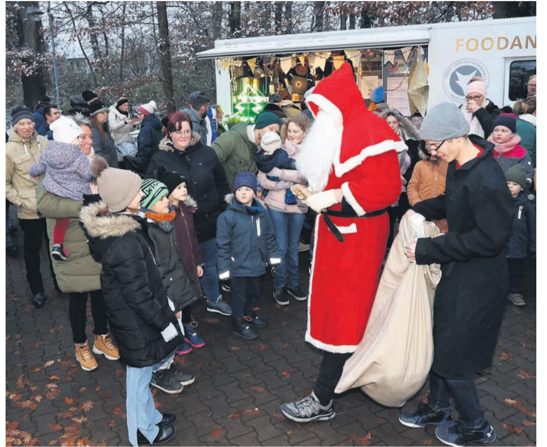
Gemütliche Enge herrschte auf dem Weihnachtsmarkt an der Waldkirche, der Nikolaus mit seinem Helfer war auch vor Ort.