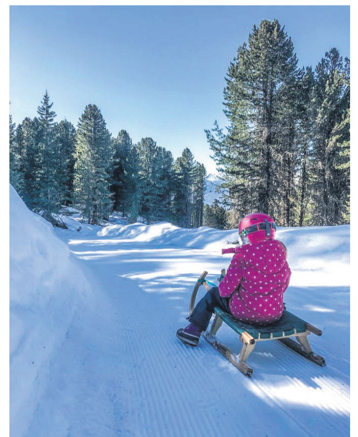
Die Panorama-Rodelbahn von der Berg- zur Mittelstation verspricht viel Spaß und Action.