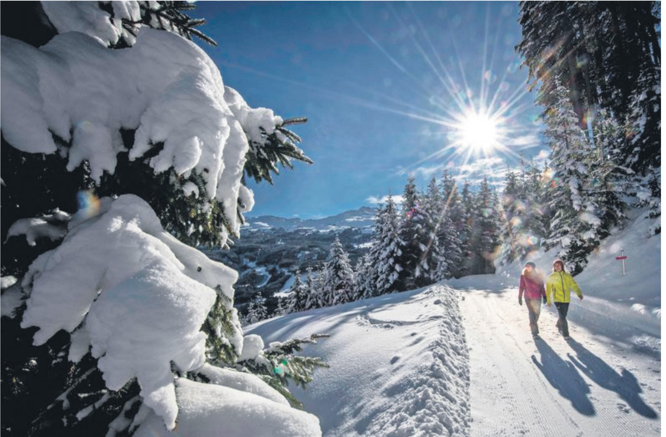
Die Wanderer erwarten ursprüngliche Natur, herrlich klare Luft und eine wunderbare Ruhe