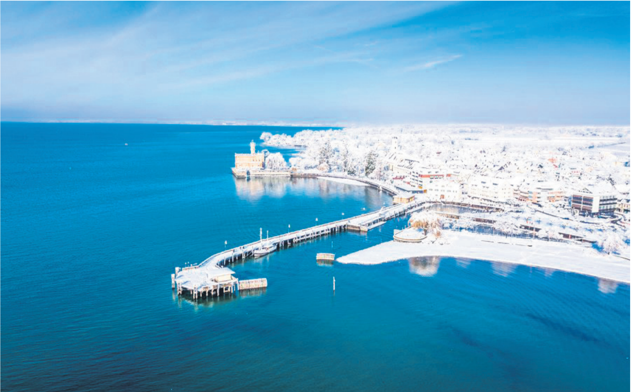
Wenn die Ufer des Bodensees in der Wintersonne glitzern, fällt es leicht, den Gleichklang mit der zur Ruhe gekommenen Natur zu finden.