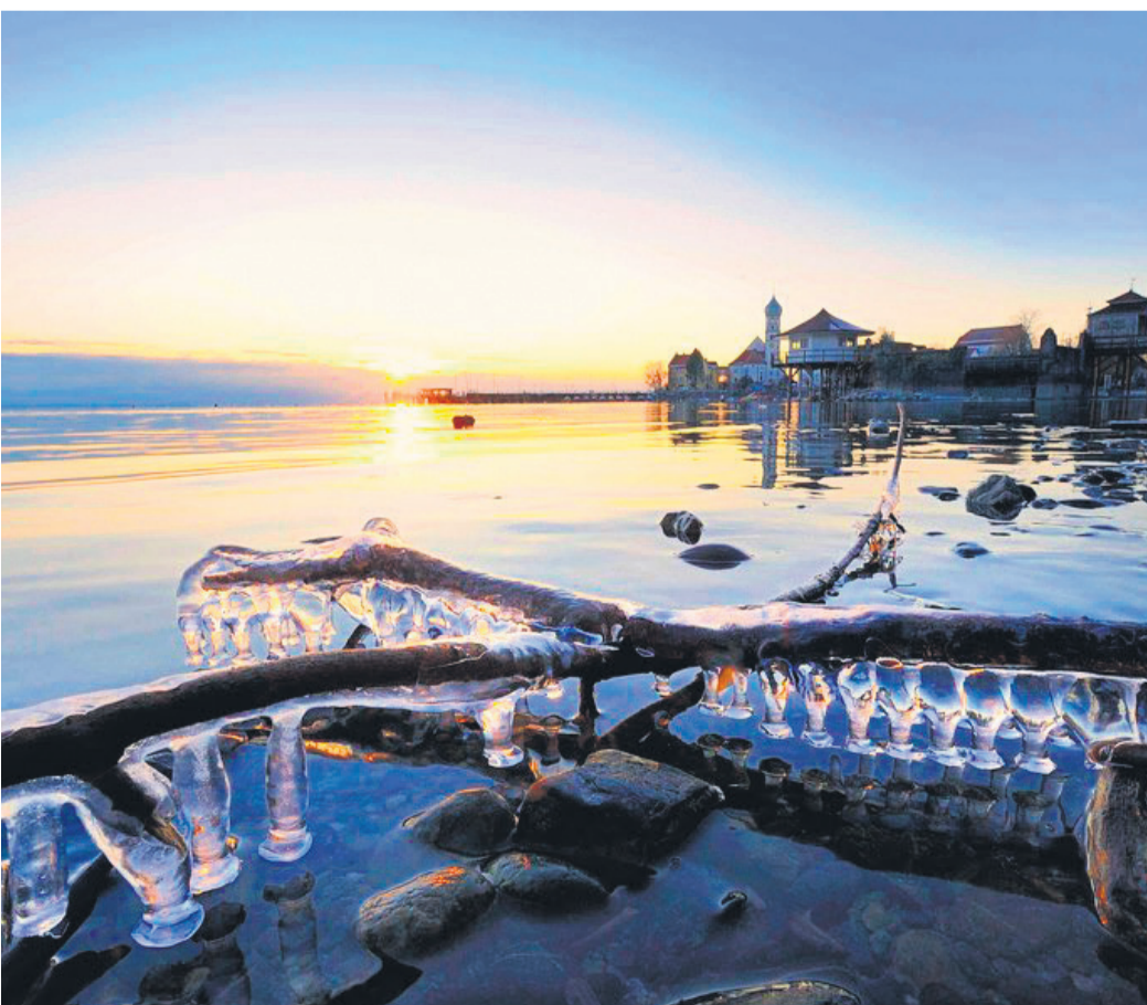
Im Winter zeigt sich der Bodensee von seiner stillen und trotzdem facettenreichen Seite.

Die Busse der „Seelinie“ verbinden Friedrichsha- fen und Überlingen und sind für Urlauber mit der „Echt Bodensee Card“ (EBC) kostenlos benutzbar. Und auch die Fähren und Katamarane der Boden- see-Schiffahrt machen im Winter keine Pause, son- dern laden zu entspannten Ausfahrten mit winterli- chen Ausblicken ein.