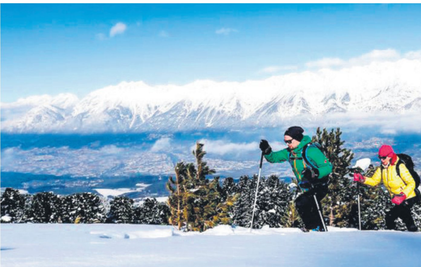
Auf Schneeschuhwanderungen durch die tief verschneite Landschaft können Urlauber die Natur in vollen Zügen genießen.

Wer es nicht ganz so sportlich mag, der kann zum Beispiel eine romantische Kutschenfahrt unternehmen, einen Spaziergang durch die mittelalterliche Haller Altstadt oder eine Nature-Watch-Tour im Naturpark Karwendel.