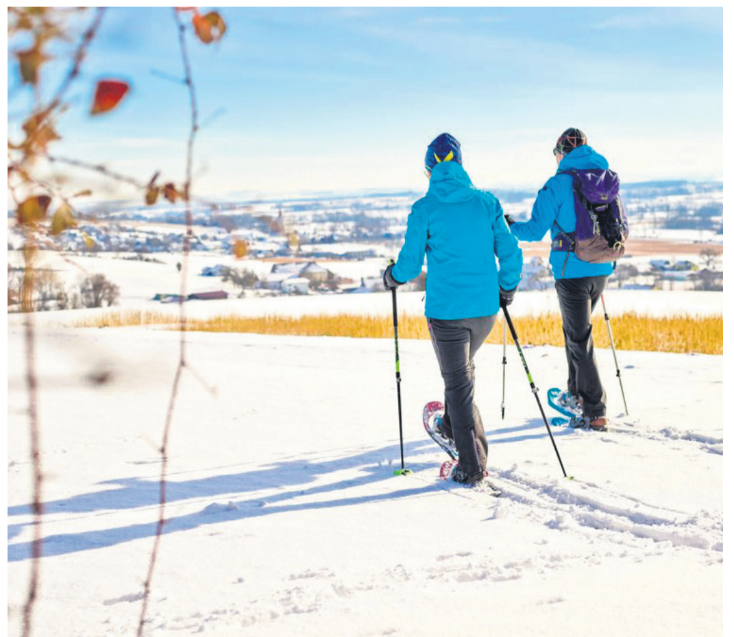
Die sanfte Hügellandschaft der „Niederbayerischen Toskana“ lässt sich im Winter auch auf Schneeschuhen entdecken.