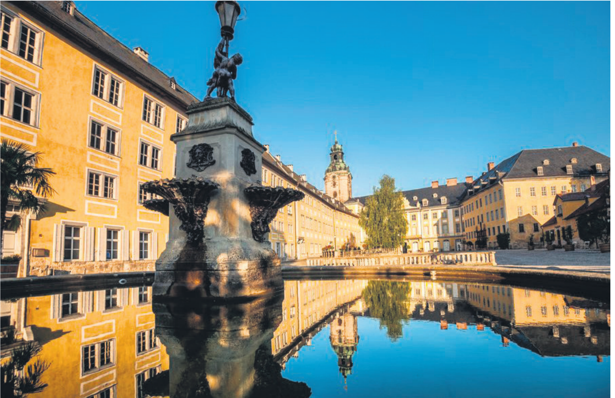
Prachtvoller Innenhof von Schloss Heidecksburg, dem ehemaligen Residenzschloss der Fürsten von Schwarzburg-Rudolstadt.