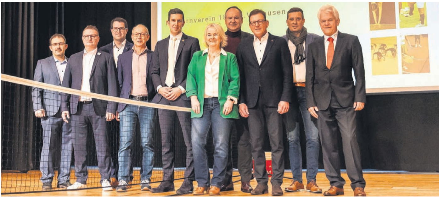
Mit Ehrengästen feierte der TV Hausen seinen Jubiläumsauftakt. Die Abteilungen präsentierten sich im Foyer.

Stimmungsvoll begannen die Feierlichkeiten zum 150-jährigen Bestehen beim TV Hausen