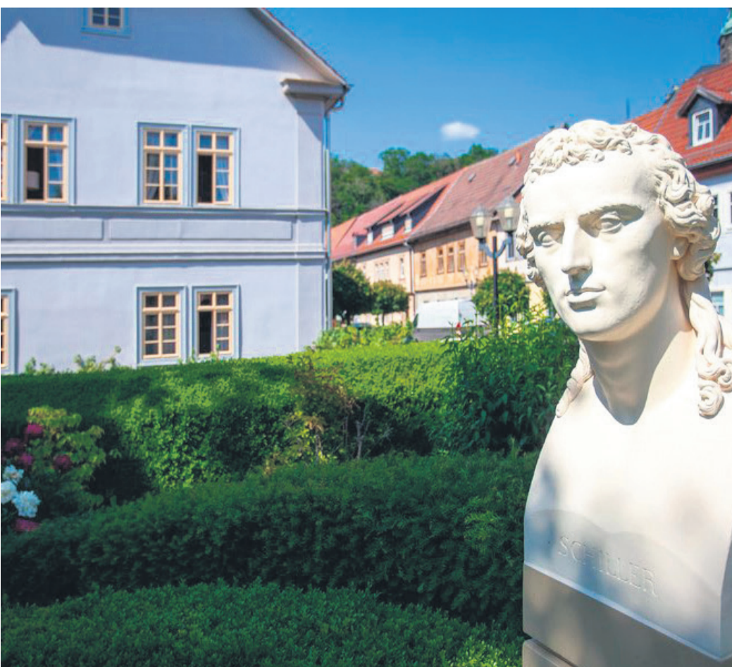
An den berühmten deutschen Dichterfürsten Friedrich Schiller wird in Rudolstadt an vielen Stellen erinnert.

die Idee geht auf die Flugpioniere Otto und Gustav Lilienthal zurück. Aus den legendären Baukästen lassen sich originalgetreue Bauwerke in beeindruckender Größe basteln. Highlights im Jahresverlauf sind das Rudolstadt-Festival, das Rudolstädter Vogelschießen, das größte Volksfest Thüringens sowie das Altstadtfest. Eine vielfältige Restaurant- und Kneipenkultur, Vorstellungen im Thüringer Landestheater Rudolstadt sowie zahlreiche Aktivmöglichkeiten runden das Freizeitangebot ab.