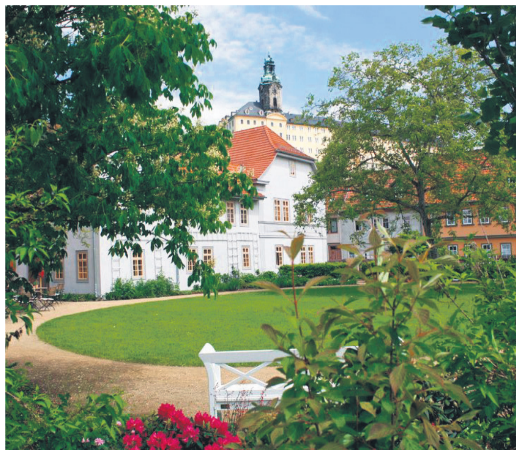
Das Schillerhaus ist heute ein dem berühmten Dichter gewidmetes Literaturmuseum. Es befindet sich im ehemaligen Wohnhaus der Familie von Lengefeld. Im September 1788 begegneten sich hier erstmals Schiller und Goethe. Im Hintergrund ist die Heidecksburg zu sehen.