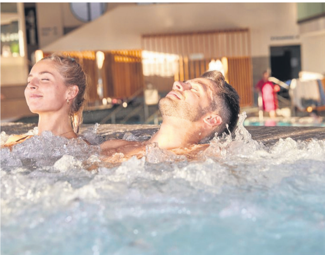
Das heilkräftige Thermal-Mineralwasser sprudelt auch in den Whirlpools der Bad Griesbacher Therme zum Wohlbefinden der Gäste.

Wer sich an der frischen Luft bewegt – ob auf Skiern, mit Schneeschuhen oder in Wandertiefeln – genießt anschließend den wohligen Ausgleich in der Wärme ganz besonders.