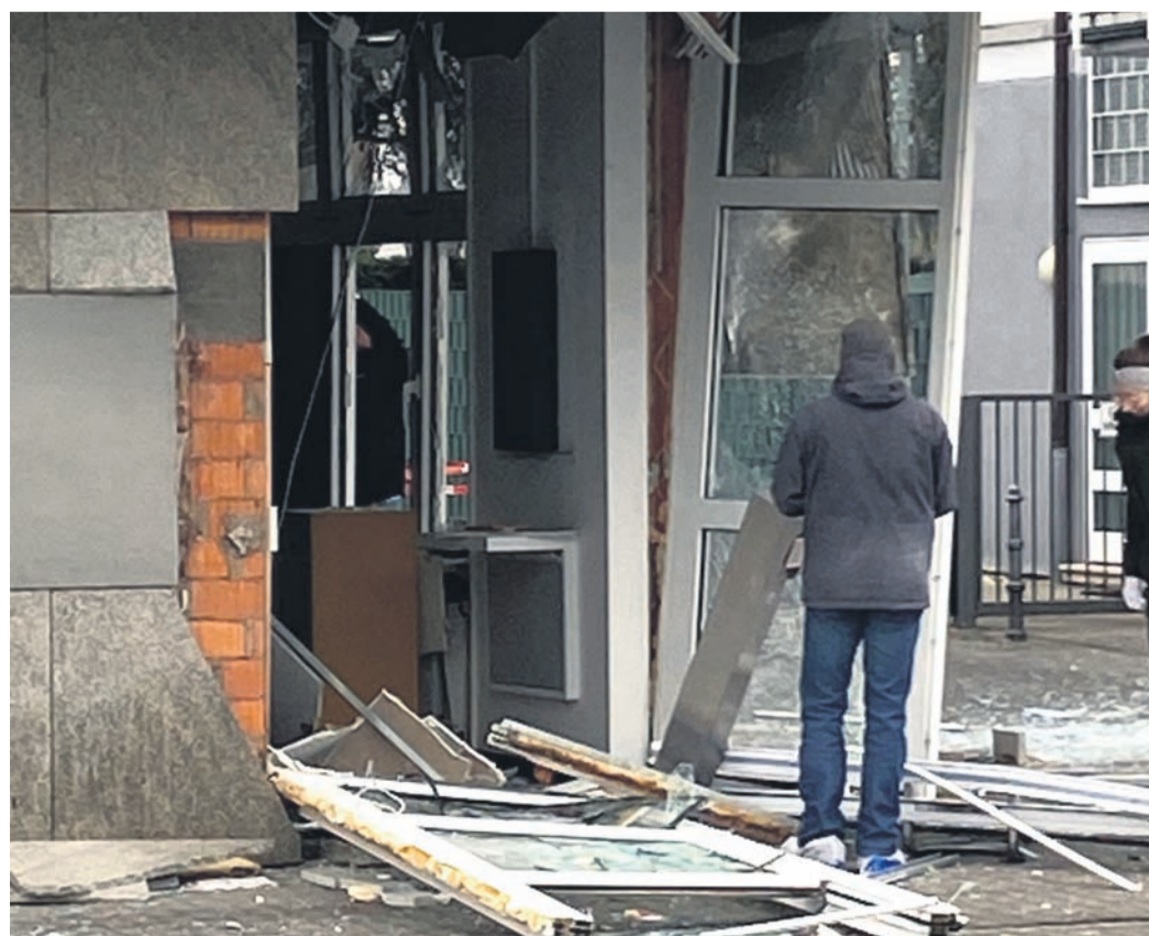
Völlig zerstört: der Eingangsbereich zur Commerzbank.

entwendeten Bargeldes und die Sachschadenshöhe am Gebäude können derzeit nicht beziffert werden. Hinweise nimmt die Kriminalpolizei Offenbach unter der Rufnummer 069/8098-1234 entgegen.