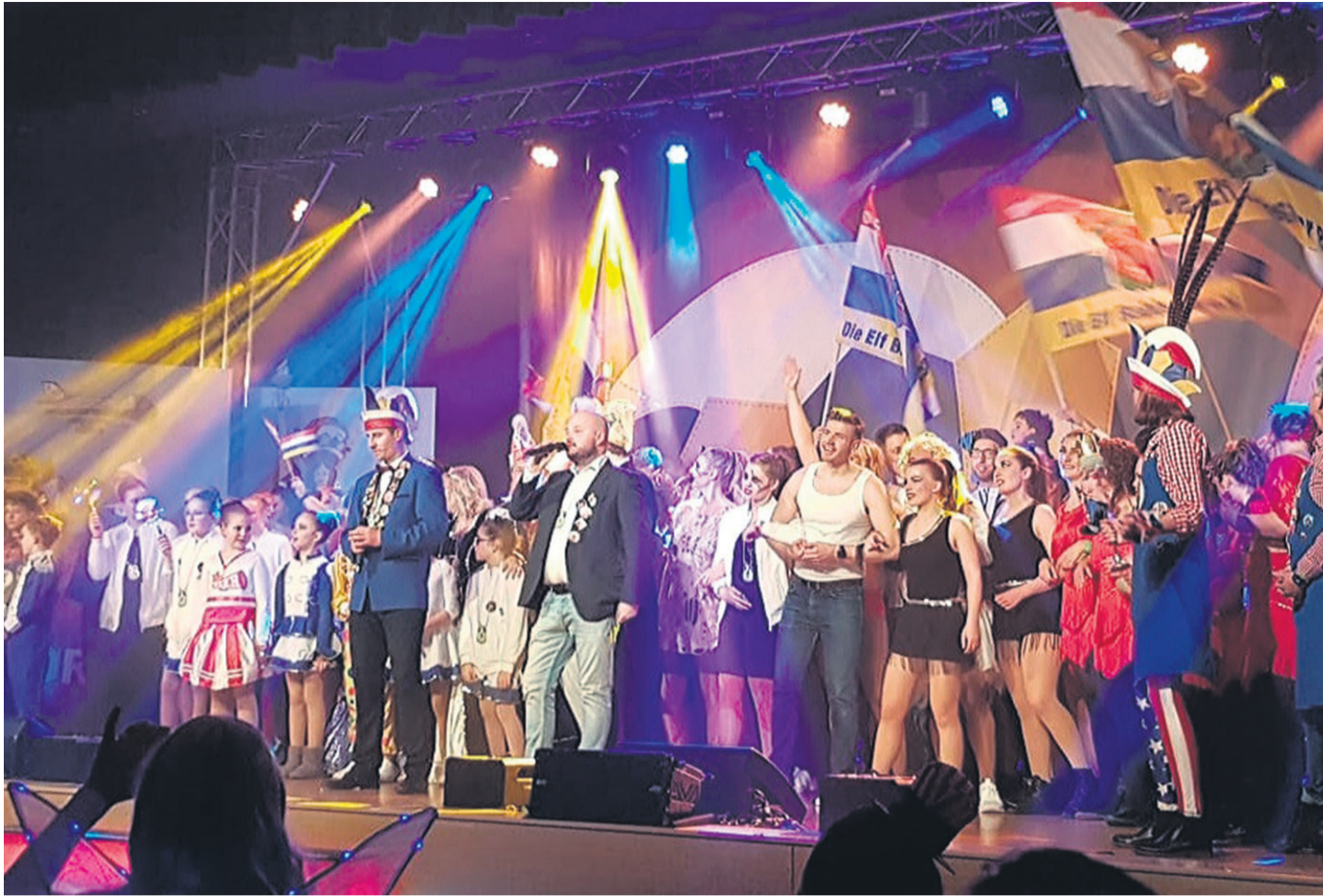
Großes Finale der Babbscher-Prunksitzung.