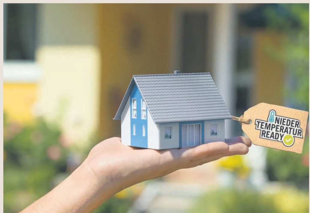
Erst dämmen, dann die Heizung modernisieren: Um ein Gebäude "ready" für Niedertemperatur zu machen, kommt es auf eine effektive Dämmung der Außenhülle an.