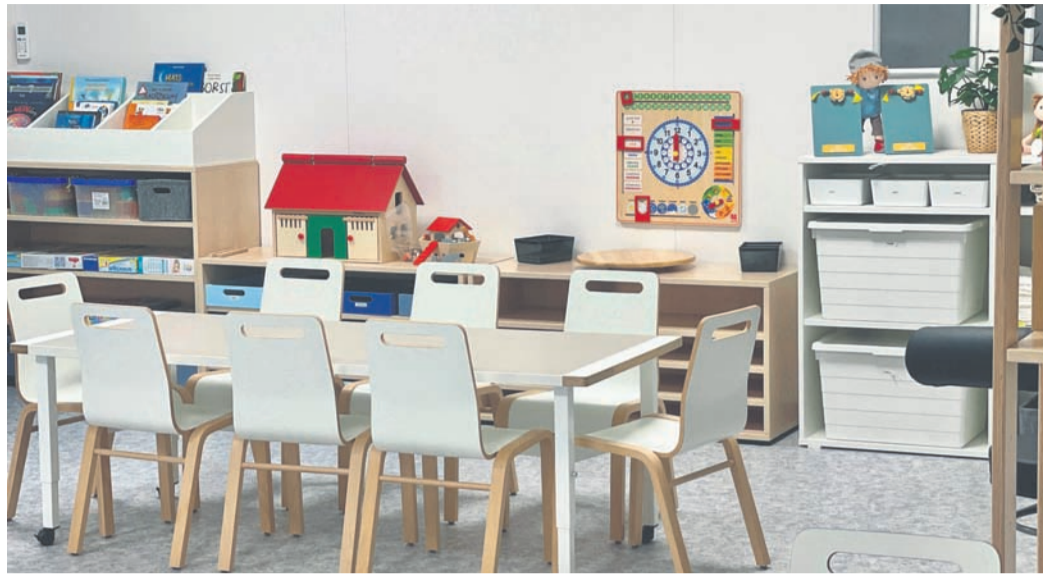
Die Kita LöwenRitt ist bereit für die Kinder unter und über drei Jahren.

Obertshausen (NZO) Endlich ist es soweit: Die Kita Löwen-Ritt des freien Trägers Terminal for Kids nimmt zum 1. Februar ihren Betrieb auf. Mit 25 Kindern in drei Gruppen startet das neunköpfige Erzieherteam in der Einrichtung an der Heusenstammer Straße. Es gibt zu Beginn zwei Gruppen mit insgesamt 14 Kindern im Alter unter drei Jahren sowie eine Gruppe mit elf Kindern über drei Jahren. Monatlich beginnen dann neue Jungen und Mädchen mit ihrer Eingewöhnung.