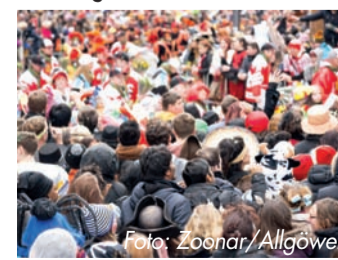
Karneval muss kein Fest für Viren sein.

wirkt ursächlich gegen Erkältungsviren, indem er sie umhüllt und daran hindert, in die Zellen der Nasenschleimhaut einzudringen. So steht einer unbeschwertem jecken Zick nichts mehr im Wege. Und: Selbst bei einer bestehenden Erkältung kann das Erkältungsspray die Symptome lindern und die Erkrankungsdauer verkürzen. 1 Weitere Informationen gibt es auf www.algovir.de .