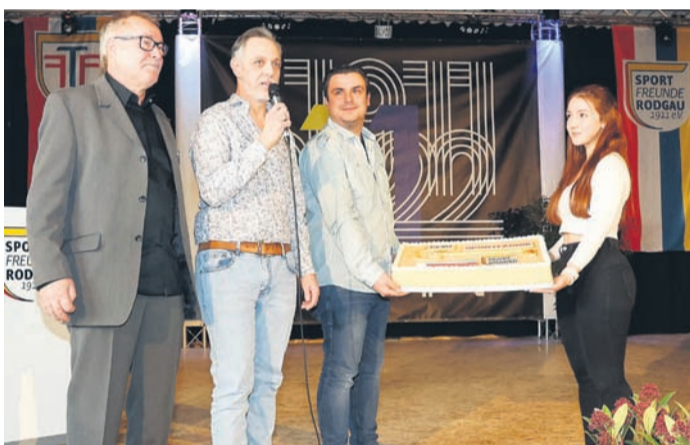
Eine Torte zur Eröffnung der Sportfabrik.

darauf hinwies, dass die Halle in energetischer Hinsicht zukunftsweisend sei. Zwischen den Ansprachen machten verschiedene Vorführungen deutlich, wie breit das Angebot der