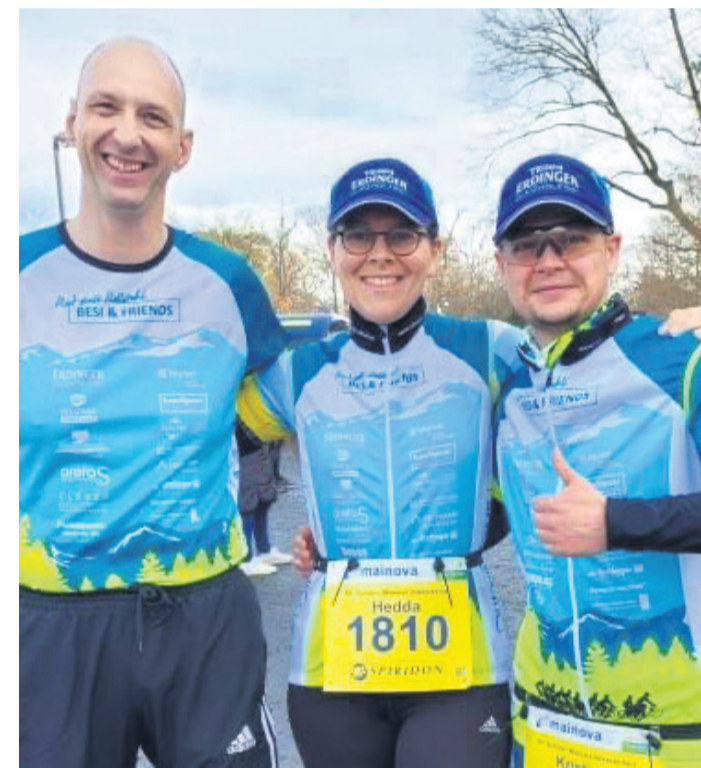
Besis beim Silvesterlauf in Frankfurt.

Atmosphäre zur Verfügung. Die CDU freut sich auf einen interessanten Abend mit vielen Fragen und Anregungen aus der Bürgerschaft.