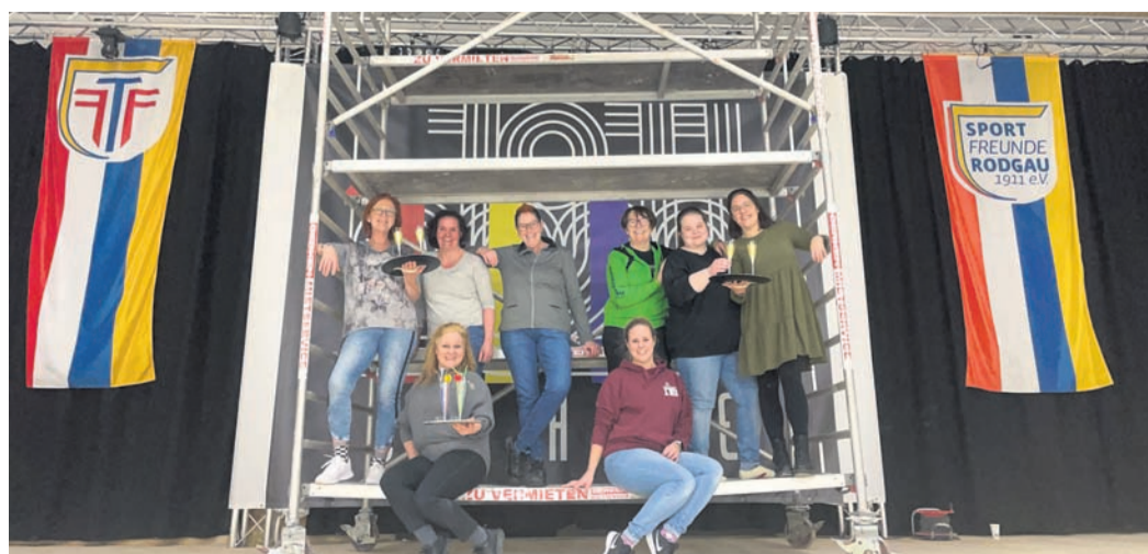
Die Proseccos auf der Bühne.

Für die meisten Sitzungen sind noch Karten verfügbar. Alle Infos sind auf der Homepage www.sportfreunde-rodgau.de und der vereinseigenen App abrufbar.