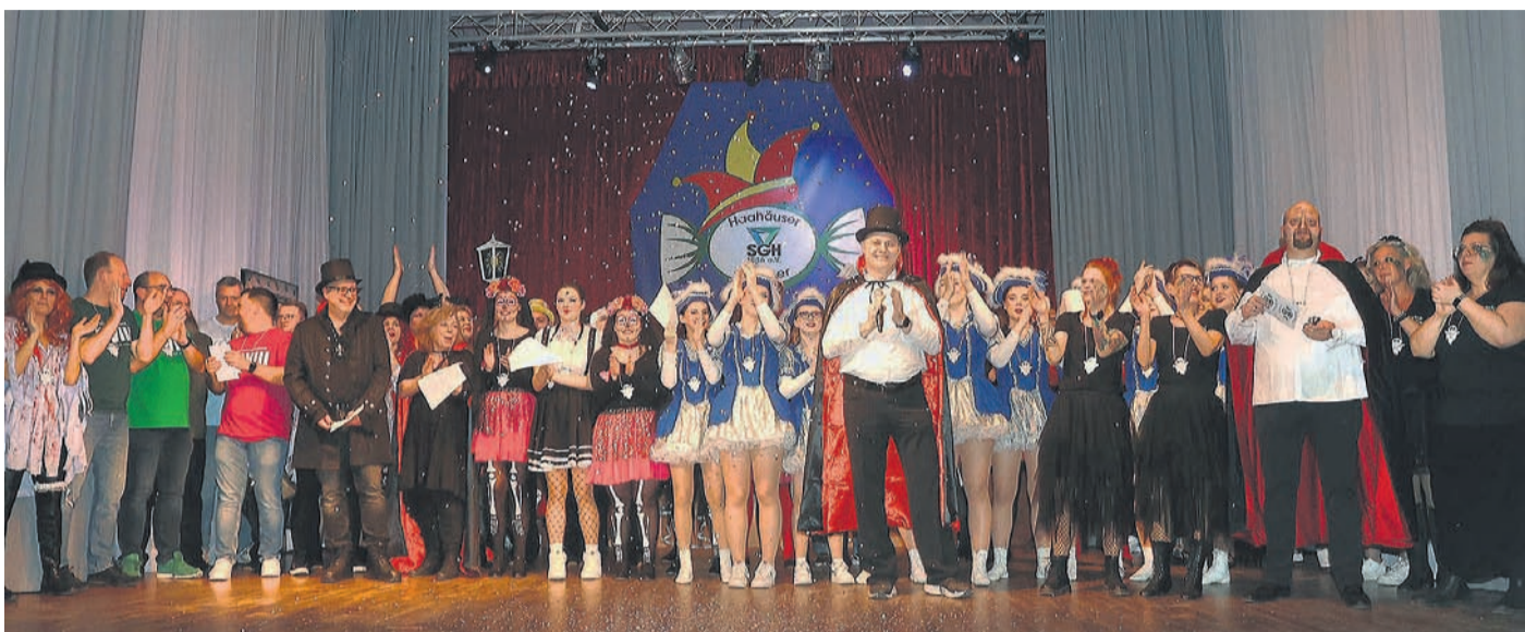
Die Fastnachter der SGH sorgten für gruselige Unterhaltung.

Unabhängiges Wochenblatt · Amtsverordnungsblatt der Stadt Rodgau