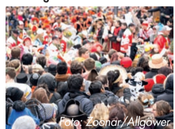
1 Koenighofer et al.: Carrageenan nasal spray in virus confirmed common cold: individual patient data analysis of two randomized controlled trials. Multidisciplinary Respiratory Medicine 2014, 9:57.

wirkt ursächlich gegen Erkältungsviren, indem er sie umhüllt und daran hindert, in die Zellen der Nasenschleimhaut einzudringen. So steht einer unbeschwertem jecken Zick nichts mehr im Wege. Und: Selbst bei einer bestehenden Erkältung kann das Erkältungsspray die Symptome lindern und die Erkrankungsdauer verkürzen. 1 Weitere Informationen gibt es auf www.algovir.de .