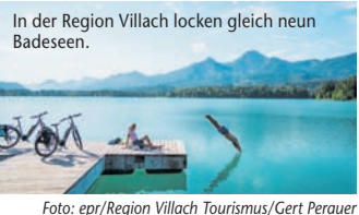
In der Region Villach locken gleich neun Badeseen.

Urlaubsglück vom Gipfel bis ins Tal – In der Region Kärnten finden Aktivurlauber und Erholungsuchende ihr „Eldorado“ (epr) Von den luftigen Höhen von Gerlitz Alpe, Verditz, Naturpark Dobratsch und Mittagkogel bis zu den glasklaren Tiefen der gleich neun Badeseen können sich Bewegungshungrige in der Region Villach voll austoben. Glück auf zwei Rädern versprechen die vielen abwechslungsreichen Fahrradstrecken, die von der gemütlichen Runde um den See bis hin zur rasanten Mountainbike-Abfahrt reichen. Die Seen locken mit Schwimmen, Surfen, Tauchen, Wasserski fahren sowie Wakeboarding und Stand-Up-Paddling. Wanderfans kommen ebenfalls auf ihre Kosten, führen doch nicht nur einige der schönsten Etappen des Alpe-Adria-Trails durch die Region. Auf verschiedenen Slow Trails heißt das Motto: Entschleunigung statt Höhenmeter, das gemütliche Spazieren ist eine willkommene Abwechslung zur steilen Bergtour. Apropos gemütlich: Um die Balance von Körper und Seele optimal auszutariieren, sollten auch Ruhepausen nicht zu kurz kommen. Ein entspannter Nachmittag auf dem Liegestuhl mit Blick auf das Bergpanorama oder eine Wellnessanwendung können Wunder wirken! Mehr Infos unter www.reiseplaza.de/villach