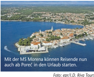
Mit der MS Morena können Reisende nun auch ab Poreč in den Urlaub starten.

Kroatien-Kreuzfahrten für Biker und Badenixen – Im Grünen Istrien in See stechen und die Perlen der kroatischen Adria entdecken (epr) Im Grünen Istrien sticht mit der MS Morena nun das erste Schiff der I.D. Riva Tours-Flotte vom neuen Abfahrtschiffen in Poreč aus in See. Dabei hat Deutschlands Spezialist für Kroatien-Reisen gleich zwei Angebote für Genussurlauber in petto: Während man auf der Fahrradrouten am Meer entlangradelt und Naturwege per Drahtesel oder E-Bike erkundet, enthüllt die Baderoute einige der schönsten Strände Kroatiens bis in die Kvarner Bucht hinein. Beide Touren umfassen eine acht-tägige Kreuzfahrt inkl. Halbpension, Willkommens-Snack, Captain's Dinner und eine Führung durch Pula, die größte und älteste Stadt Istriens. Das glanzvolle Highlight beider Kreuzfahrten bildet die Übernachtung im Nationalpark Brijuni: Insgesamt vierzehn Inseln gehören zu dem 36 km² großen Nationalpark. Neben dem Eintritt sind auch eine Rundfahrt mit der Minibahn sowie der Besuch des Museums „Interaktives Bootshaus“ und der Ausstellung „Tito auf Brijuni“ inklusive. Mehr unter www.reiseplaza.de/idriva