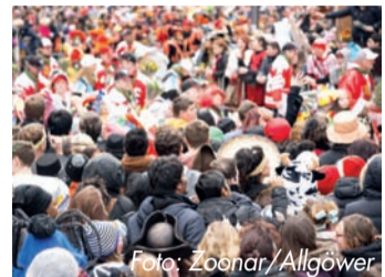
Karneval muss kein Fest für Viren sein.

wirkt ursächlich gegen Erkältungsviren, indem er sie umhüllt und daran hindert, in die Zellen der Nasenschleimhaut einzudringen. So steht einer unbeschwerteren Erkältung das Erkältungsspray die Symptome lindern und die Erkrankungsdauer verkürzen. 1 Weitere Informationen gibt es auf www.algovir.de .