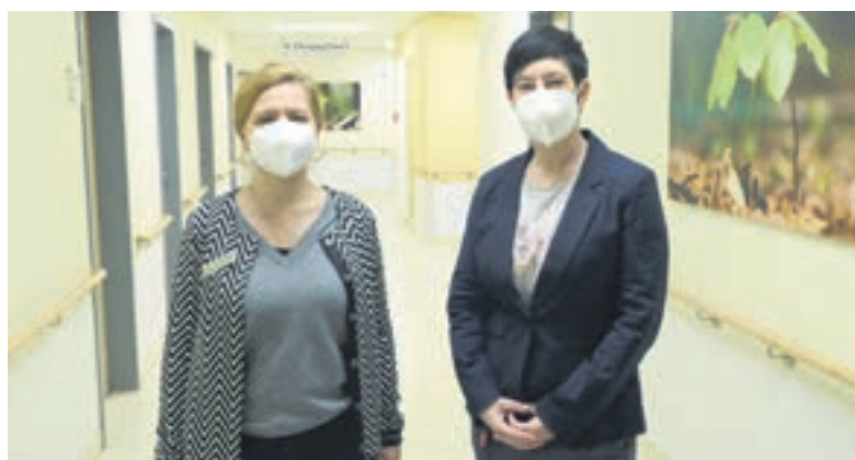
So sieht der Alltag der Pflegedienstleiterinnen aus.