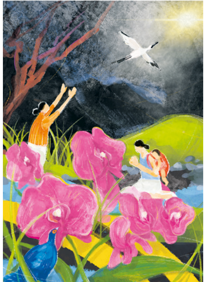
Bild zum Weltgebetstag 2023: „I Have Heard About Your Faith“ von der taiwanesischen Künstlerin Hui-Wen Hsiao.

(JED) Über Länder- und Konfessionsgrenzen hinweg engagieren sich Frauen seit über 100 Jahren für den Weltgebetstag. Dieses Jahr laden uns Frauen aus Taiwan ein, daran zu glauben, dass wir diese Welt zum Positiven verändern können. Denn – so lautet das Motto: „Glaube bewegt“! In Arheilgen finden dazu zwei Veranstaltungen in der Kreuzkirche statt, die von einem ökumenischen Team aus der Auferstehungsgemeinde, Kreuzkirchengemeinde und Heilig Geist vorbereitet werden. Am Montag, 27. Februar, gibt es ab 18:30 Uhr einen Info-Abend zu Taiwan. Als Gast dürfen wir Frau Hsien-Yen