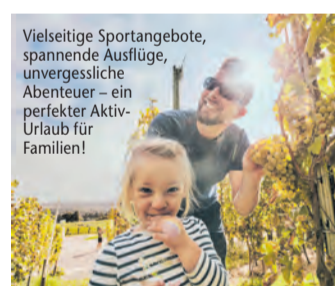
Vielseitige Sportangebote, spannende Ausflüge, unvergessliche Abenteuer – ein perfekter Aktiv-Urlaub für Familien!

Aktivurlaub für Familien an der Mosel – Die Römische Weinstraße verbindet Spaß, Abenteuer, Genuss und Entspannung (epr) Von Action über Kultur und Natur bis hin zur Entspannung – und dabei stets im Mittelpunkt: die Familie. Und für die hat die Römische Weinstraße ein vielseitiges Angebot vor Ort. Egal ob zu Fuß oder auf dem Rad – es lohnt sich, die Mosel und ihre Seitentäler zu erkunden. Wer sich jedoch am liebsten direkt auf dem Fluss austoben möchte, kann das mit abenteuerlustigen Wassersportarten. Egal ob Wasserski oder Wakeboard, selbst Reiten auf dem Bananaboat ist möglich! Neben den zahlreichen sportlichen Aktivitäten bietet die Römische Weinstraße als historisch geprägte Region auch interessante Sehenswürdigkeiten. Ein Blick auf die gut erhaltenen, architektonisch eindrucksvollen Römervillen lohnt sich genauso wie ein Besuch der nahegelegenen Römerstadt Trier. Und wenn sich nach dem Stillen des Wissensdurstes auch der Magen meldet, laden Restaurants, Weingüter und Vinotheken zur Stärkung ein. Mehr unter www.reiseplaza.de/roemische-weinstrasse