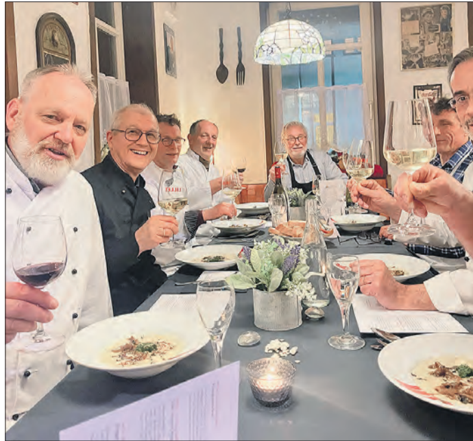
EIN HERRLICH GEDECKTER TISCH mit selbst gekochten Köstlichkeiten – ein ganz besondere Männerrunde erfreut sich dieser Genüsse. Interessierte Männer sind herzlich willkommen.

Der Anspruch der Männerrunde: Kochen auf hohem Niveau, frische jahreszeitliche Produkte, möglichst aus der Region, kein Einsatz von Convenience, gepflegte Tischsitten bis hin zu kreativ gestalteter Tischdekoration – alles wird selbst gemacht! Glücklicherweise konnte für ihr anspruchsvolles Hobby ein ideales Domizil gefunden werden: das Gasthaus „Zur Sonne“ in Alsbach, Hauptstraße 18, mit einer tollen Profiküche und behaglichen Gasträumen für das gemeinsame Essen, der zuvor zubereiteten internationalen Spezialitäten. Von dienstags bis sonntags wird hier sehr schmackhafte deutsche und