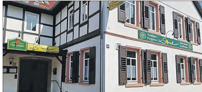
DAS GASTHAUS „ZUR SONNE“ in Alsbach-Hähnlein.

im Monat in der Sonne aktiv! Die Idee eines Clubs, der sich dem Kochen und der Tafelfreude