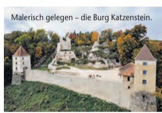
Malerisch gelegen – die Burg Katzenstein.

Auf den Pfaden historischer Herrschaftssitze – Der Albschäferweg in der Heidenheimer Brenzregion führt Wanderer entlang geschichtsträchtiger Burgen, Schlösser und Ruinen (epr) Auf dem Albschäferweg in der Heidenheimer Brenzregion auf der Schwäbischen Alb erleben Wanderer nicht nur eindrucksvolle Natur, sondern auch imposante Geschichte(n) hautnah. Auf zehn Etappen führt der 158 km lange Rundkurs vorbei an wunderschönen historischen Gemäuern. So etwa das Schloss Hellenstein, das Wahrzeichen der Stadt Heidenheim. Das Schloss und die integrierte Burgruine bieten alljährlich den stimmungsvollen Rahmen der Opernfestspiele. Nahe der Charlottenhöhe entdecken Wanderer die Kaltenburg. Nach vielen Zerstörungen und einem Einsturz ist das Kulturdenkmal heute saniert. Eine der ältesten erhaltenen romanischen Burgenanlagen Süddeutschlands ist die Burg Katzenstein. Sie liegt leicht versteckt auf dem sogenannten Katzenfelsen und begeistert die Gäste mit Kunst, Kultur und Kulinarik. Nicht zuletzt lockt auch das Schloss Brenz im unteren Brenzental, das im 17. Jahrhundert auf Fundamenten einer ehemaligen Burg errichtet wurde. Mehr dazu unter www.reiseplaza.de/heidenheimer-brenzregion