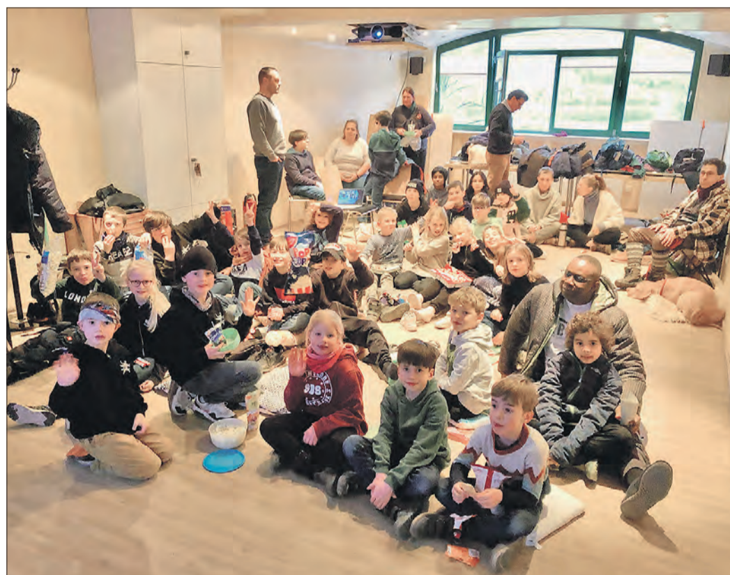
KINO-NACHMITTAG – Alle Beteiligten hatten jede Menge Spaß.

Nicht nur 28 Kinder und Jugendliche sondern auch erwachsenen Karatekas haben am Kino-Nachmittag teilgenommen. Bei sehr vielen leckeren Movie-Snacks, zusammen mit ihren Sportfreunden und tollen Videos zum Thema Karate und Kampfkunst hatten alle jede Menge Spaß. Solche zusätzlichen Veranstaltungen, die immer wieder von der Karateabteilung organisiert werden, sind unerlässlich um den Gemeinschaftssinn immer mehr zu stärken. (TVS)