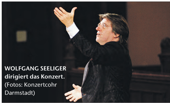
WOLFGANG SEELIGER dirigiert das Konzert.

Mit seiner 160-jährigen Tradition ist das Göttinger Symphonieorchester im kulturellen Leben der Universitätsstadt fest etabliert, gehört aber auch als „Reiseorchester Niedersachsens“ zu den angesehensten Klangkörpern im Norden