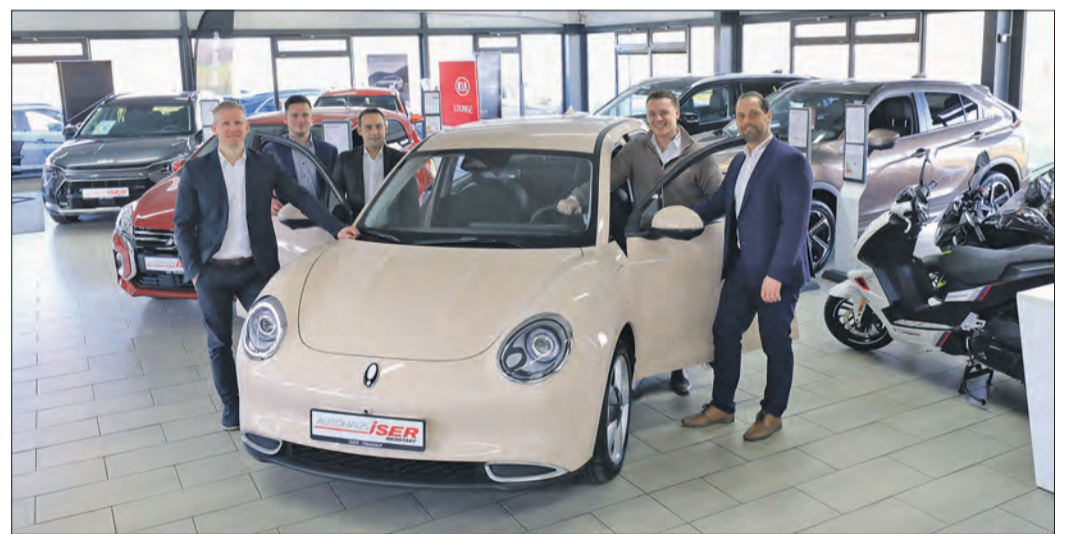
DAS VERKAUFSTEAM mit dem neuen „Ora Funky Cat“.

Wer Ora Funky Cat kennenlernen möchte, kann beim Autohaus Iser in Riedstadt vorbeischauen, weitere Informationen gibt es auch auf Facebook und bei Instagram. (PR / as)