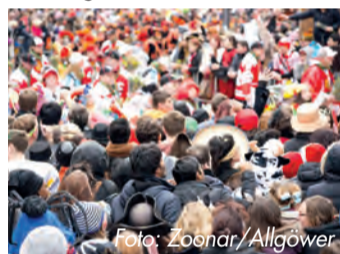
Karneval muss kein Fest für Viren sein.

wirkt ursächlich gegen Erkältungsviren, indem er sie umhüllt und daran hindert, in die Zellen der Nasenschleimhaut einzudringen. So steht einer unbeschwerten jecken Zick nichts mehr im Wege. Und: Selbst bei einer bestehenden Erkältung kann das Erkältungsspray die Symptome lindern und die Erkrankungsdauer verkürzen. 1 Weitere Informationen gibt es auf www.algovir.de .