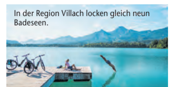
In der Region Villach locken gleich neun Badeseen.

Urlaubsglück vom Gipfel bis ins Tal – In der Region Kärnten finden Aktivurlauber und Erholungsuchende ihr „Eldorado“ (epr) Von den luftigen Höhen von Gerlitzen Alpe, Verditz, Naturpark Dobratsch und Mittagkogel bis zu den glasklaren Tiefen der gleich neun Badeseen können sich Bewegungshungrige in der Region Villach voll austoben. Glück auf zwei Rädern versprechen die vielen abwechslungsreichen Fahrradstrecken, die von der gemütlichen Runde um den See bis hin zur rasanten Mountainbike-Abfahrt reichen. Die Seen locken mit Schwimmen, Surfen, Tauchen, Wasserski fahren sowie Wakeboarding und Stand-Up-Paddling. Wanderfans kommen ebenfalls auf ihre Kosten, führen doch nicht nur einige der schönsten Etappen des Alpe-Adria-Trails durch die Region. Auf verschiedenen Slow Trails heißt das Motto: Entschleunigung statt Höhenmeter, das gemütliche Spazieren ist eine willkommene Abwechslung zur steilen Bergtour. Apropos gemütlich: Um die Balance von Körper und Seele optimal auszurufen, sollten auch Ruhepausen nicht zu kurz kommen. Ein entspannter Nachmittag auf dem Liegestuhl mit Blick auf das Bergpanorama oder eine Wellnessanwendung können Wunder wirken! Mehr Infos unter www.reiseplaza.de/villach