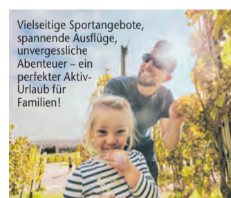
Vielseitige Sportangebote, spannende Ausflüge, unvergessliche Abenteuer – ein perfekter Aktiv-Urlaub für Familien!