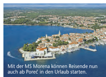
Mit der MS Morena können Reisende nun auch ab Poreč in den Urlaub starten.

Kroatien-Kreuzfahrten für Biker und Badenixen – Im Grünen Istrien in See stechen und die Perlen der kroatischen Adria entdecken (epr) Im Grünen Istrien sticht mit der MS Morena nun das erste Schiff der I.D. Riva Tours-Flotte vom neuen Abfahrtschiff in Poreč aus in See. Dabei hat Deutschlands Spezialist für Kroatien-Reisen gleich zwei Angebote für Genusurlauber in petto: Während man auf der Fahrradrouten am Meer entlangradelt und Naturwege per Drahtesel oder E-Bike erkundet, enthüllt die Baderoute einige der schönsten Strände Kroatiens bis in die Kvarner Bucht hinein. Beide Touren umfassen eine acht-tägige Kreuzfahrt inkl. Halbpension, Willkommens-Snack, Captain's Dinner und eine Führung durch Pula, die größte und älteste Stadt Istriens. Das glanzvolle Highlight beider Kreuzfahrten bildet die Übernachtung im Nationalpark Brijuni: Insgesamt vierzehn Inseln gehören zu dem 36 km² großen Nationalpark. Neben dem Eintritt sind auch eine Rundfahrt mit der Minibahn sowie der Besuch des Museums „Interaktives Bootshaus“ und der Ausstellung „Tito auf Brijuni“ inklusive. Mehr unter www.reiseplaza.de/idriva