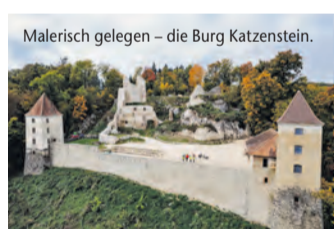
Malerisch gelegen – die Burg Katzenstein.

Auf den Pfaden historischer Herrschaftssitze – Der Albschäferweg in der Heidenheimer Bregenzregion führt Wanderer entlang geschichtsträchtiger Burgen, Schlösser und Ruinen (epr) Auf dem Albschäferweg in der Heidenheimer Bregenzregion auf der Schwäbischen Alb erleben Wanderer nicht nur eindrucksvolle Natur, sondern auch imposante Geschichte(n) hautnah. Auf zehn Etappen führt der 158 km lange Rundkurs vorbei an wunderschönen historischen Gemäuern. So etwa das Schloss Hellenstein, das Wahrzeichen der Stadt Heidenheim. Das Schloss und die integrierte Burgruine bieten alljährlich den stimmungsvollen Rahmen der Opernfestspiele. Nahe der Charlottenhöhe entdecken Wanderer die Kaltenburg. Nach vielen Zerstörungen und einem Einsturz ist das Kulturdenkmal heute saniert. Eine der ältesten erhaltenen romanischen Burgenanlagen Süddeutschlands ist die Burg Katzenstein. Sie liegt leicht versteckt auf dem sogenannten Katzenfelsen und begeistert die Gäste mit Kunst, Kultur und Kulinarik. Nicht zuletzt lockt auch das Schloss Brenz im unteren Brenzental, das im 17. Jahrhundert auf Fundamenten einer ehemaligen Burg errichtet wurde. Mehr dazu unter www.reiseplaza.de/heidenheimer-bregenzregion