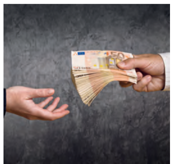
Es geht um viel Geld.

Bei einem Widerruf erhalten Sie – anders als bei der Kündigung – alle eingezahlten Beiträge ohne Abzug von Maklerprovisionen und Verwaltungskosten zurück. Und nicht nur das: Die Versicherung muss Sie auch an dem mit Ihrem Geld erzielten Anlagegewinn beteiligen. So können Sie bis zu 150 % der eingezahlten Beiträge zurückholen. Ein sattes Plus auf Ihrem Konto winkt!