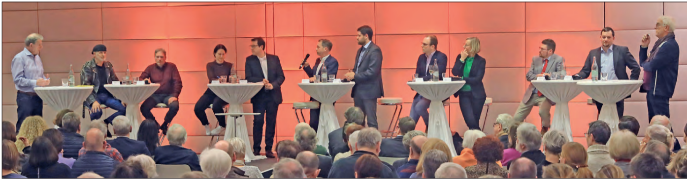
Zahlreiche Gäste informierten sich über die Bewerber*innen um das Oberbürgermeisteramt.