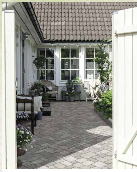
Für den Klimaschutz: Pflaster Passeo KlimaPlus.

Mit dem neuen Klimastein hat Rinn einen Stein entwickelt, der (fast) ohne Zement auskommt und der daher einen signifikant