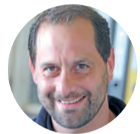
Peter Erbach Autohaus Iser Riedstadt