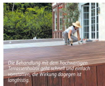
Die Behandlung mit dem hochwertigen Terrassenholz geht schnell und einfach vonstatten, die Wirkung dagegen ist langfristig.

Zur optimalen Sommerfigur – Dank erstklassigem Terrassenholz ist der Außenbereich bestmöglich geschützt und erstrahlt in frischem Glanz (epr) Der nächste Sommer kommt bestimmt – für viele von uns heißt das: Terrassenzeit! Mit dem Terrassenholz 236 von LEINOS erfährt das Outdoor-Wohnzimmer eine hochwertige Ölharzbehandlung, die sich für alle Hölzer im Außenbereich eignet. Das gilt speziell für unbehandelte oder geölte, die im Gegensatz zu Teakholz eine zusätzliche Tiefenimprägnierung brauchen. Dabei frischt das Öl auf, erhält die natürliche Elastizität des Materials und schützt bestens gegen die Unbilden von Wind und Wetter. Zudem verleiht es Terrasse, Zaun und Gartenmöbel – außer bei der Variante 002 Farblos – einen guten UV-Schutz. Der Farbton 005 Bräunlich kommt derweil für Eiche, Robinie, Thermoholz sowie alle Nadelhölzer in Frage, während 052 Rötlich speziell bei Bangkirai, Lärche oder Douglasie Verwendung findet. Die eigentliche Verarbeitung geht schnell und einfach vonstatten, am Ergebnis dagegen kann man sich langfristig erfreuen. Mehr unter www.homeplaza.de/leinos