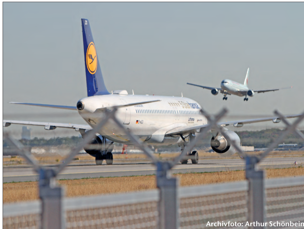
Archivfoto: Arthur Schönbein