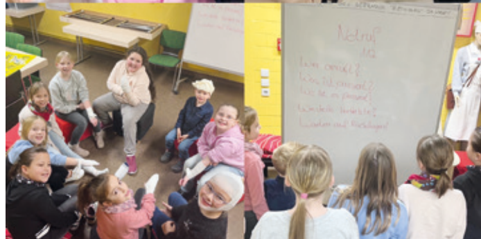
Die jungen JRK-Helfer:innen während ihrer Gruppenstunde.

ihren Möglichkeiten bei Veranstaltungen. So wird seitens des JRKs beispielsweise bei der Blutspende geholfen: Die Teeausgabe und Kinderbetreuung liegt in ihren Händen. Am Seniorennachmittag der Gemeinde übernehmen sie regelmäßig den Garderobendienst und selbstverständlich sind sie bei Veranstaltungen wie dem Blaulicht-Nikolaus