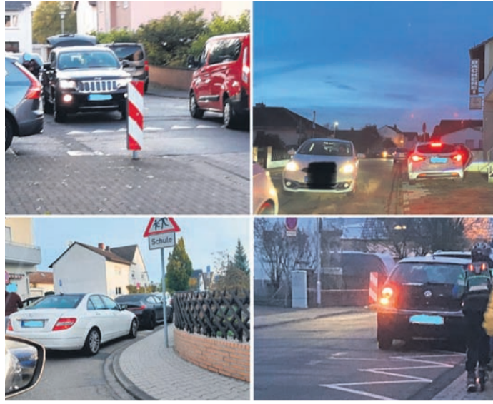
Tagtäglich in der „Rushhour“ morgens und am frühen Nachmittag kommt es an den Eingängen der John-F-Kennedy-Grundschule in Münster zu teils gefährlichen Situationen. Mit neuen Halteverbotszonen soll sich das jetzt ändern.