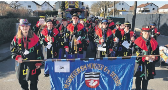
Am vergangenen Fastnachtsdienstag fand bei tollem Wetter der große Dieburger Fastnachtsumzug statt. Wie jedes Jahr war auch der Musikverein Münster mit dabei und sorgte mit seinen Fastnachtstücken für gute Stimmung bei allen Besucher*innen des gut besuchten Umzuges.