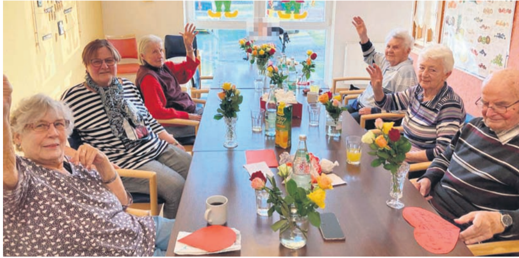
Gute Laune und Geselligkeit bei der Tagespflege in Harreshausen. Auch Münsterer Bürgerinnen und Bürger sind herzlich willkommen.

Eppertshausen (EA) Nachdem die ersten beiden Etappen von der Quelle auf der Neunkircher Höhe bis nach Groß-Zimmern von den Wanderern des Odenwaldklub Eppertshausen bewältigt wurden, lädt der Verein alle interessierten Wanderer für Sonntag, 19. März, zur 3. Etap-