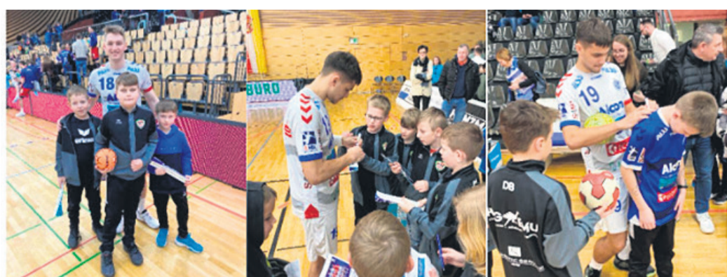
Beim Besuch des 2. Ligaspiels TV Großwallstadt gegen HBW Balingen-Weilstetten konnten die E-Junioren teilweise zum ersten Mal Bundesliga erleben. Allerdings wurde es nur Mitte der 2. Halbzeit spannend, als Großwallstadt kurzzeitig den Vorsprung auf Balingen auf nur zwei Tore verkürzen konnte.

1. Begrüßung, 2. Gedenken an die verstorbenen Mitglieder des Musikvereins 1914 Münster, 3. Ehrungen, 4. Berichte der Schriftführer, 5. Berichte der Dirigenten und Gruppenleiter, 6. Bericht des Rechners, 7. Bericht der Kassenprüfer, 8. Ergänzungswahl Vorstand, 9. Wahl der Kassenprüfer, 10. Behandlung vorliegender Anträge, 11. Verschiedenes.