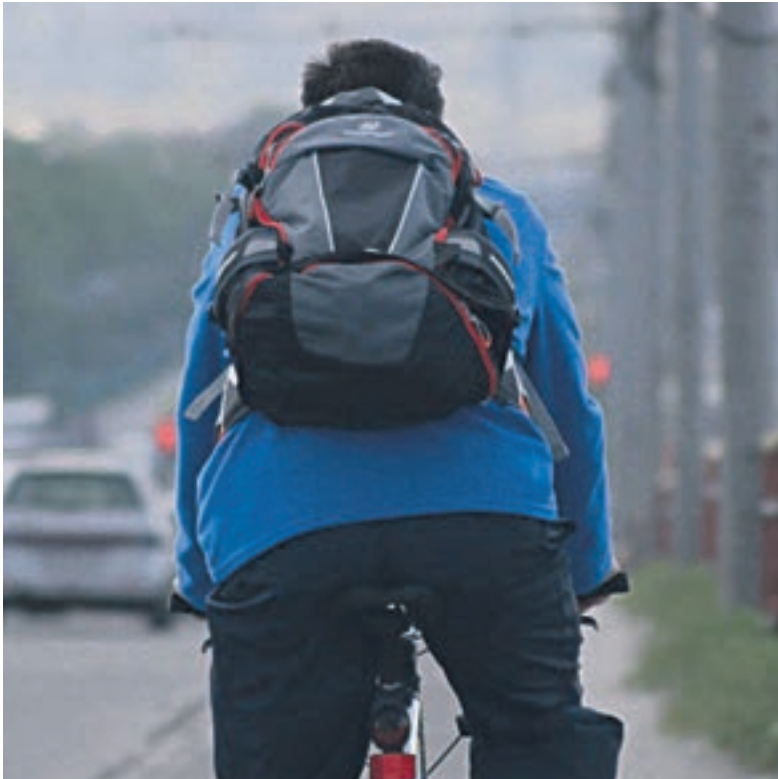
Zum Schutz aller Verkehrsteilnehmer bedarf es mehr gegenseitiger Rücksichtnahme.