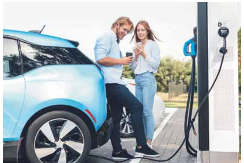
Attraktivität der E-Mobilität steigt weiter. Kfz-Versicherungen genauer anzusehen kann sich lohnen.

Schadenfreiheit von der jährlich sinkenden Selbstbeteiligung. Nach jedem schadenfreien Jahr verringert sich der Selbstbehalt um 50 Euro und kann so bis auf null Euro sinken. Auch andere Anbieter sind kreativ – es lohnt sich also, genau zu recherchieren.