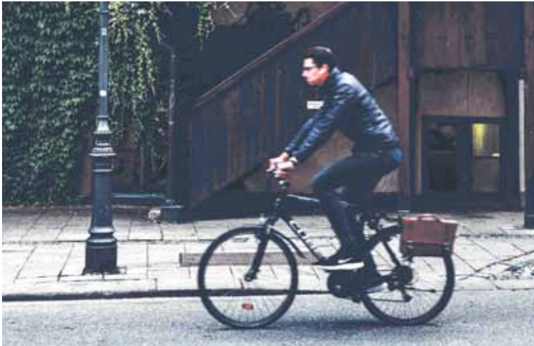
Volle Dröhnung: Auf keinen Fall darf man mit aufgesetzten Kopfhörern und hoher Lautstärke am Straßenverkehr teilnehmen.