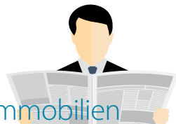
Designed by freepik

Herr Daniel sucht: Kaufe Pelze, Alt-, Bruch-, Zahn- gold, Goldschmuck. Suche Lampen, Perücken, Puppen, Bernstein, Haushaltsauflösungen, Bleikristalle, Bilder, Modeschmuck, Silber, Leder- und Krokotaschen, Schallplatten, Schreib- und Nähmaschinen, Figuren, Gobelins, Teppiche, Porzellan, Krüge, Zinn, Möbel, Küchen, Gardinen, Tischdecken, Uhren. Kostenl. Beratung. Anfahrt sowie Wertschätzung. Zahle Höchstpreise. 100% diskret, Barabwicklung vor Ort. Mo.-So. 7.30-21 Uhr. ☎ 069 - 34875842