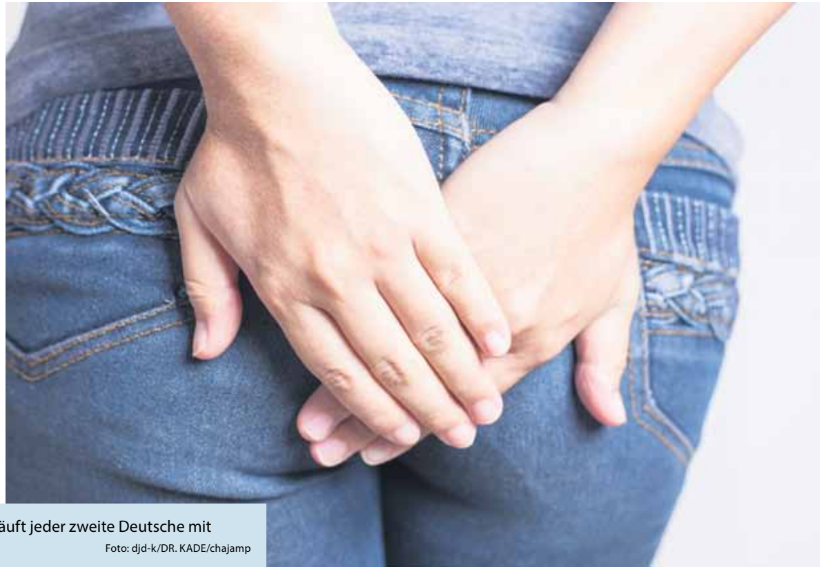
Immer noch ein Tabu-Thema, dabei läuft jeder zweite Deutsche mit vergrößerten Hämorrhoiden herum.

(DJD-K). Jeder hat sie – keiner mag darüber reden. Die Gewebepolster rund um den Darmausgang sorgen für seine Feinabdichtung und erledigen damit einen überaus wichtigen Job. Probleme können Hämorrhoiden bereiten, wenn sie sich vergrößern. Risikofaktoren sind unter anderem zunehmendes Alter, Schwangerschaft, Bewegungsmangel, sitzende Tätigkeiten und erbliche Veranlagung. Unter www.posterisan.de gibt es hierzu einen Selbsttest. Cremes und Zäpfchen können akute Beschwerden meist gut lindern. So dient etwa Posterisan akut zur lokalen Betäubung bei Schmerzempfinden und Juckreiz, während beispielsweise Faktu lind Brennen und Nässen behandelt. Auf lange Sicht sollten Betroffene mit ballaststoffreicher Kost, viel Trinken, Bewegung und Beckenbodentraining gegensteuern.