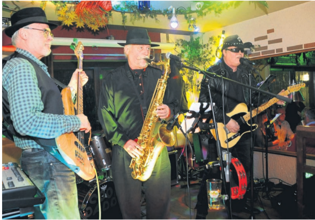
Cool Daddy kommen erneut auf die Münsterer „River Night“. Das Foto zeigt sie bei einem früheren Auftritt im „Minsdere Pilsstibbsche“, wo sie am 18. März erneut gastieren.

Dass die IG River Night 2022 auf einen Termin Ende Juni und gleich zwei Tage musikalischen Spektakel mit insgesamt sechs Bands gegangen war, hatte einen besonderen Grund: Die kleine, aus fünf Personen bestehende Interessengemeinschaft wurde zehn Jahre alt. Zudem hatte die klassische Indoor-Variante des Festivals 2020 und 2021 coronabedingt ausfallen müssen. Was gerade im ersten Corona-Jahr wehtat, als die River Night in der Region eins der ersten Musikevents überhaupt war, die dem Lockdown zum Opfer fiel. Was für den dritten Samstag in diesem März glücklicherweise kein Drohszenario mehr ist. Mit dem Summer Special gelang den Machern vorigen Sommer ein Coup. Allein am Samstag kamen bei freiem Eintritt mehr als 1 000 Musikfans an den Bahnhof. Verein Radsport, Wandergesellschaft,